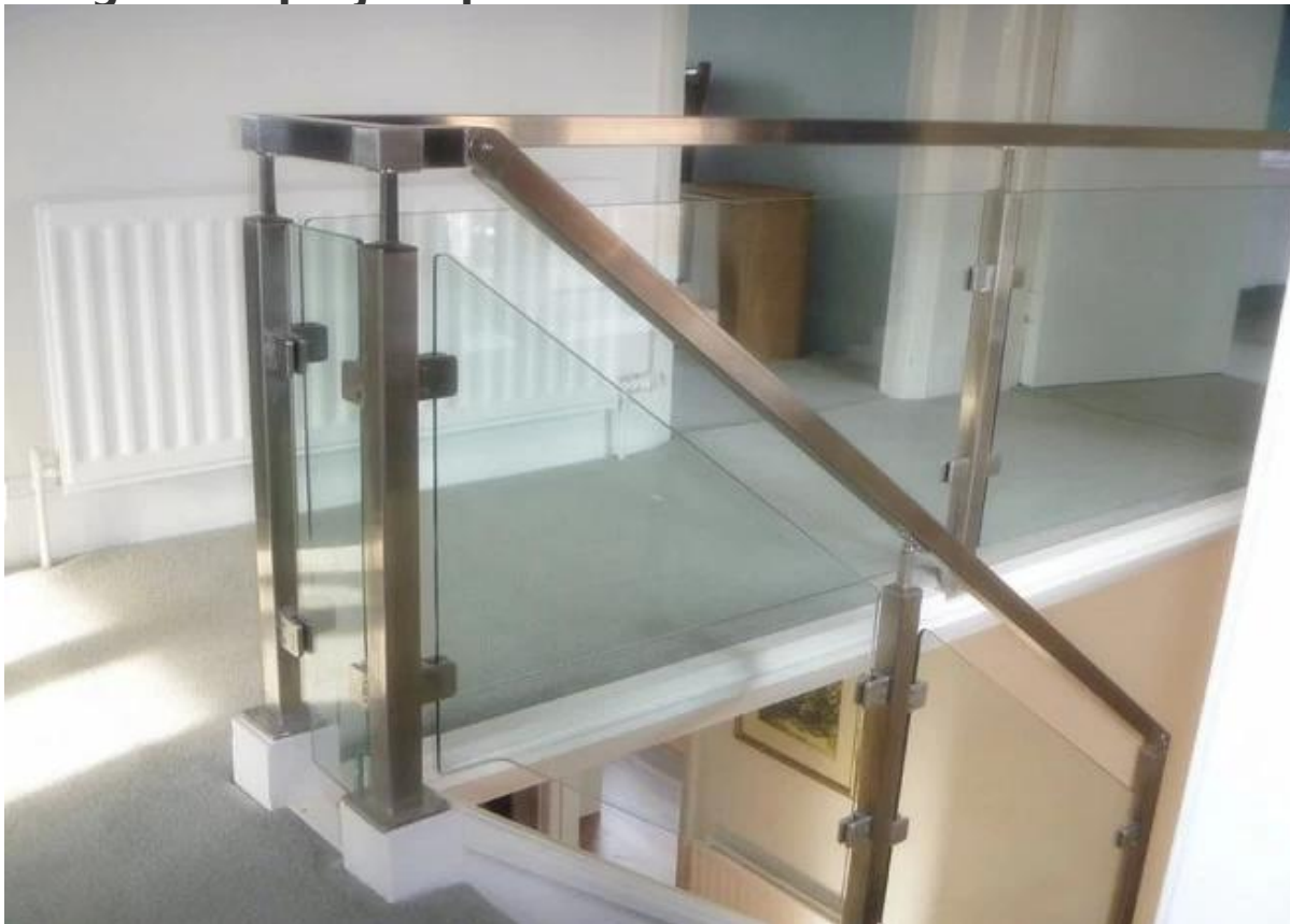
Imagem do projeto para referência: