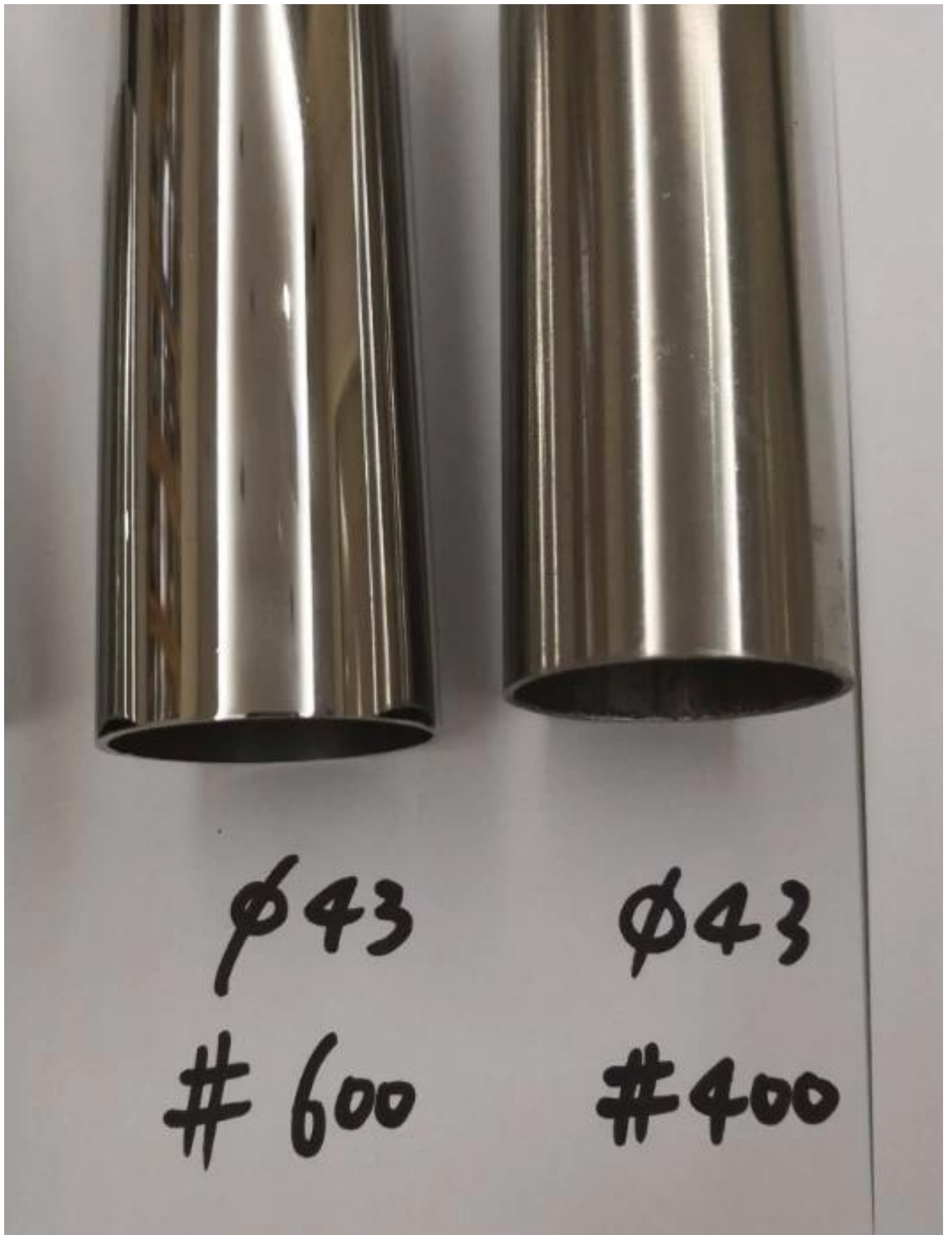
Fotos de produção para tubo corrimento de aço inoxidável