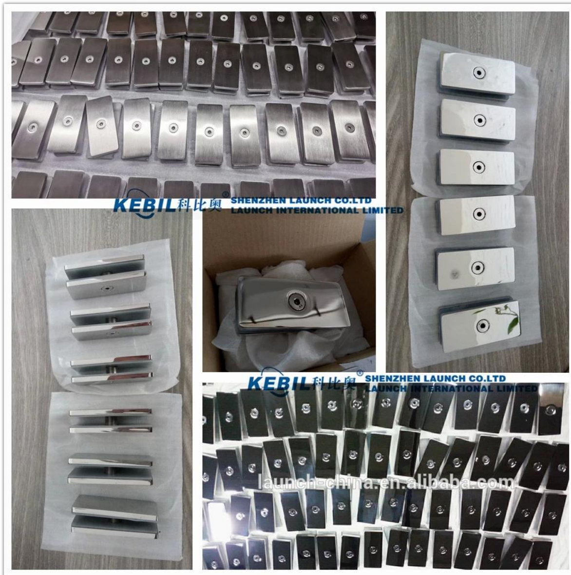
fotos Project Glass braçadeira

tempo de espera --Regular: 7 dias se produtos estão em estoque. Cerca de 20 dias se os produtos não estão em stock. Ele depende em quantidade.