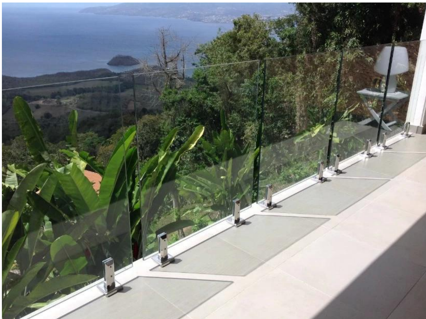
SBM em acabamento de cetim: