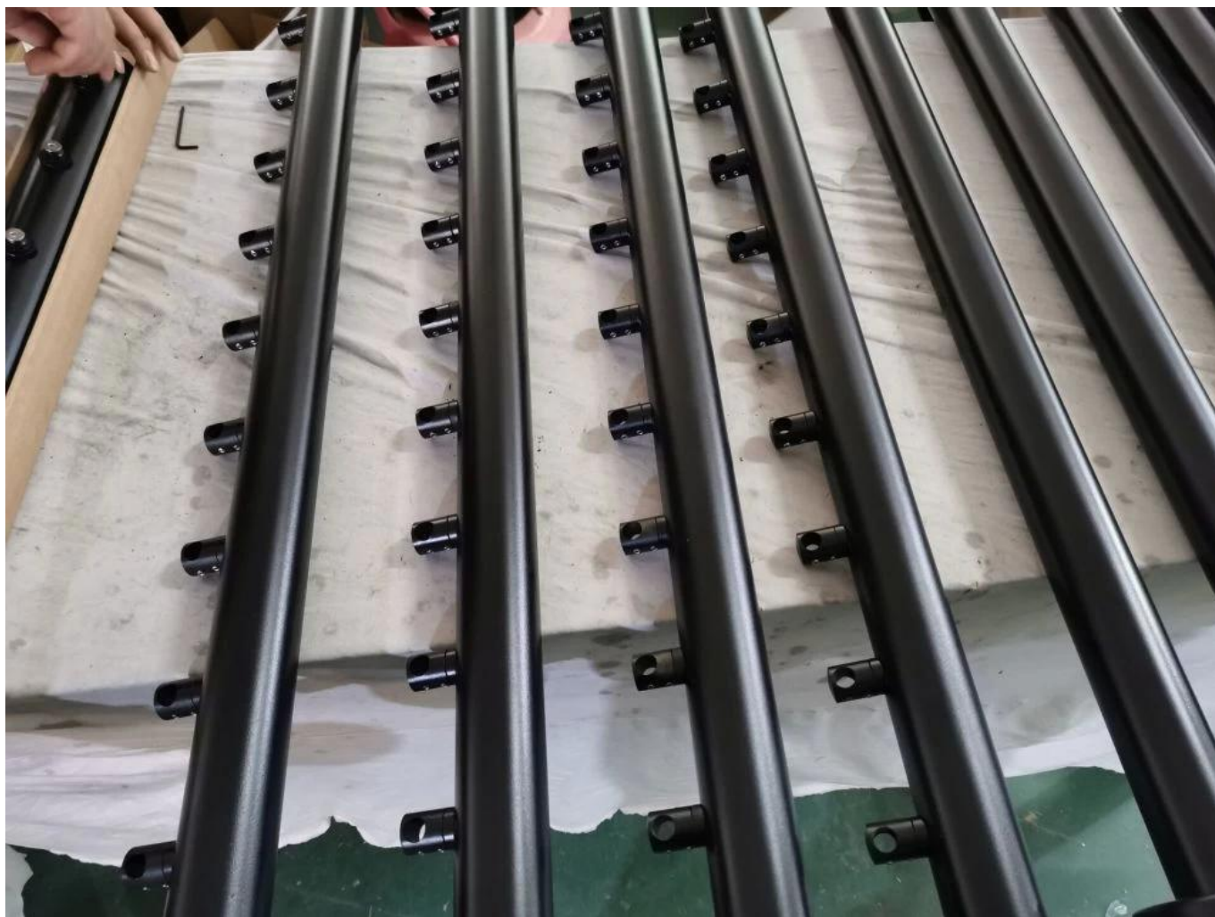
6 fotos do projeto para Sistema de trilhos de haste de aço inoxidável Conector de barra de suporte de barra