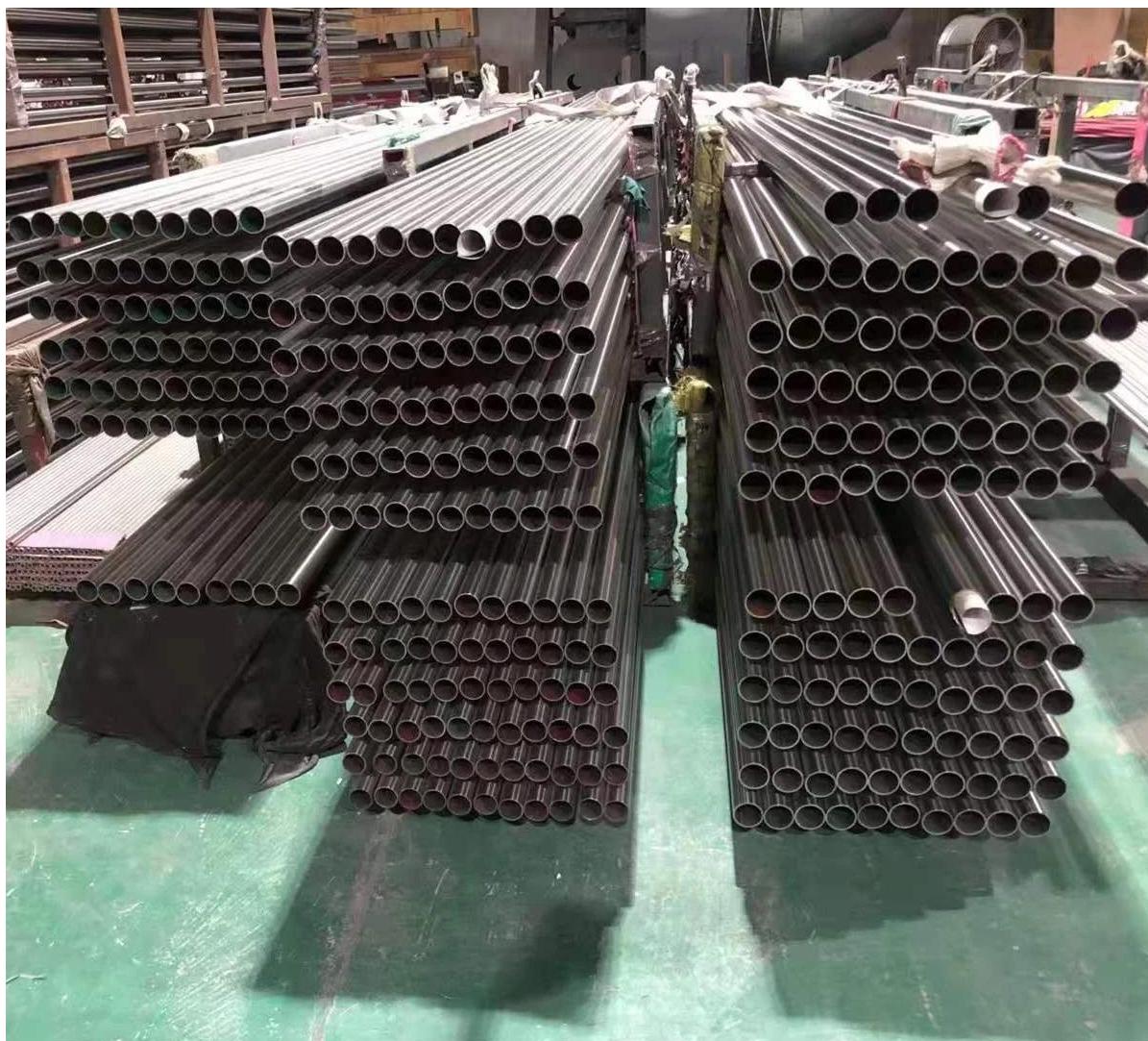
Tubo de aço inoxidável do tubo da balaustrada do revestimento do pó preto