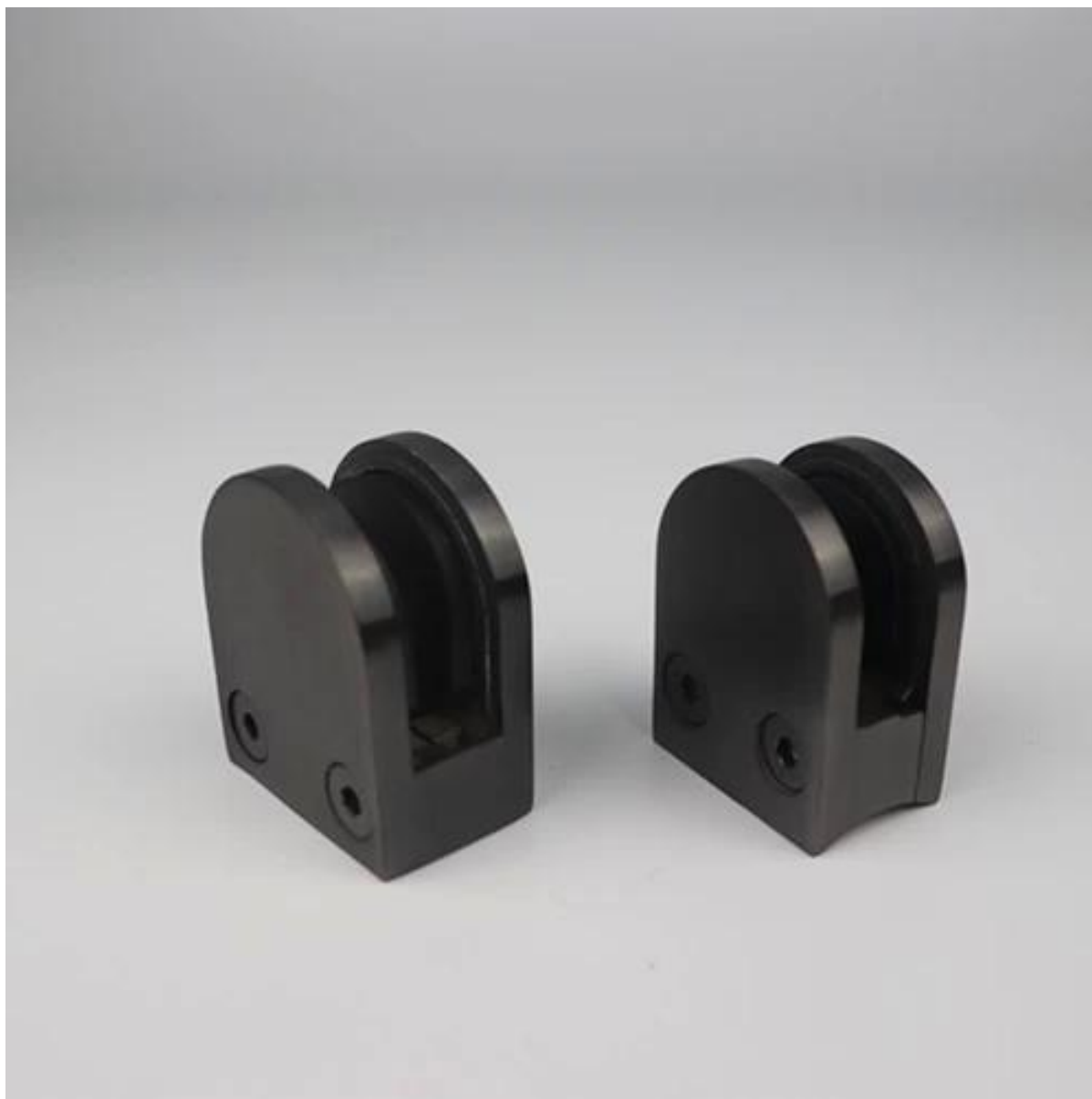
Braçadeira do vidro do olhar da madeira do projeto 2.New