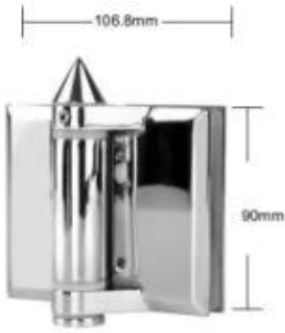
Part # G-G

Maximum door leaf weight : 30 kg /pair Maximum door leaf width : 900mm Spring can be adjusted for closing speed control .