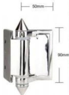
Part # G-W