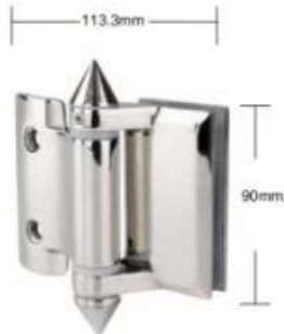
Part # G-R