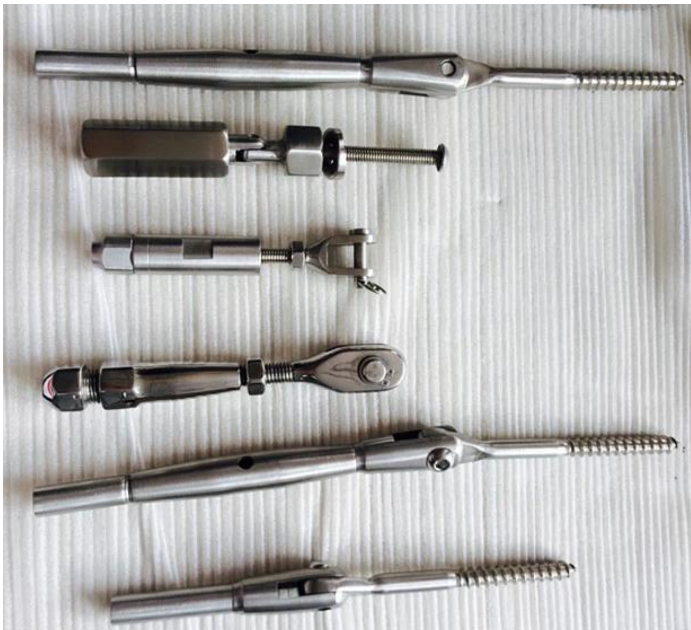
Poste de balaústres com cabo: