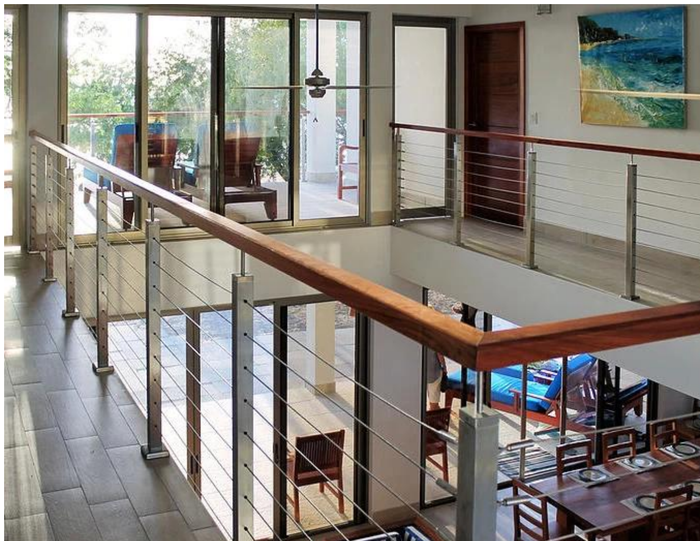
Tensores de cabo / acessórios para cabos: