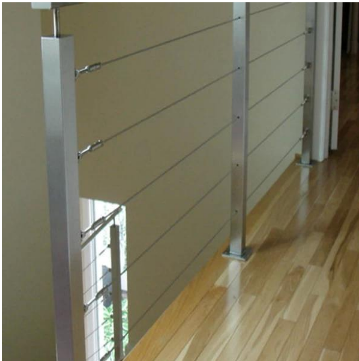
projetos diferentes para sua escolha