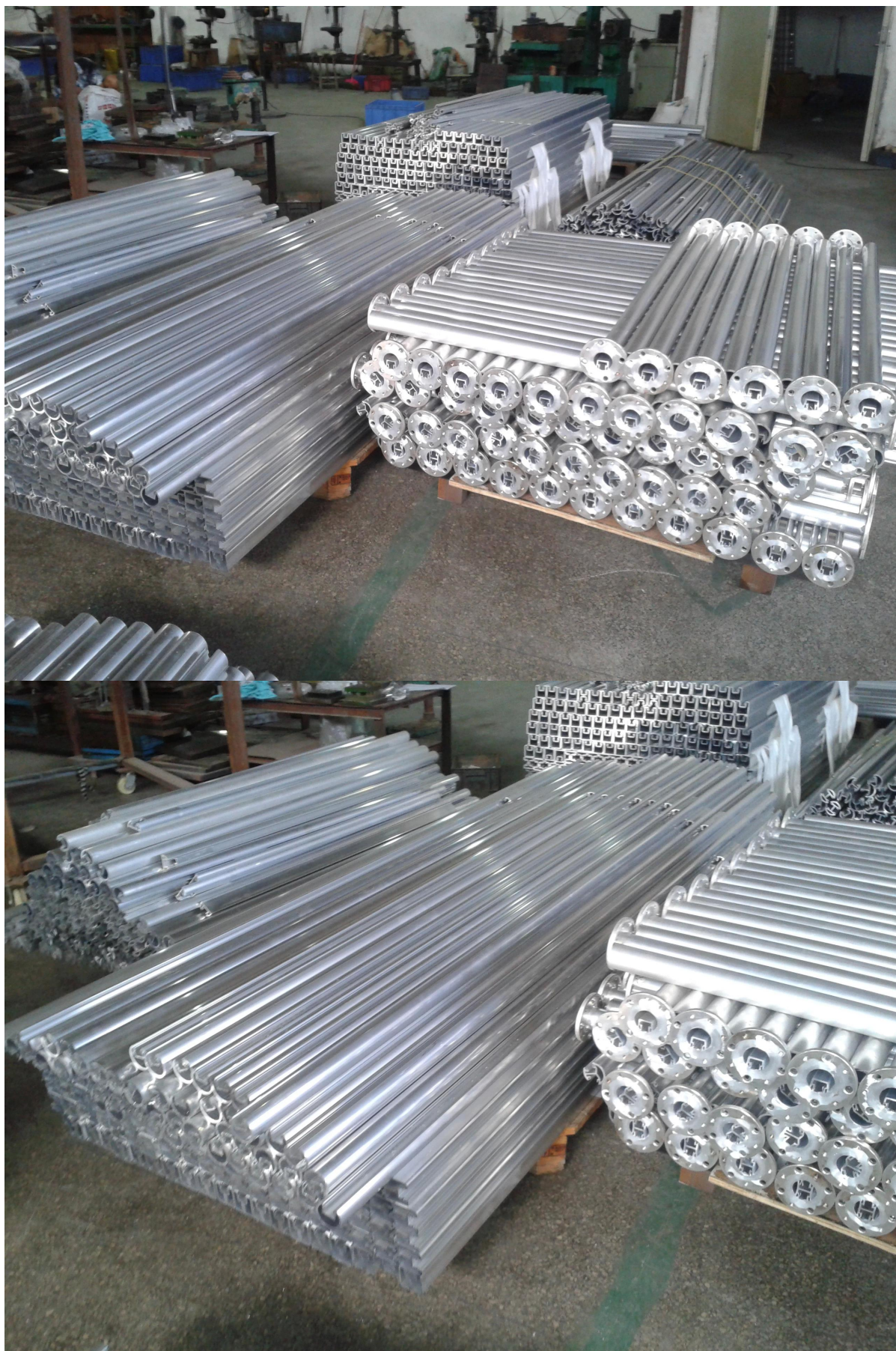
pic projeto cor cinza