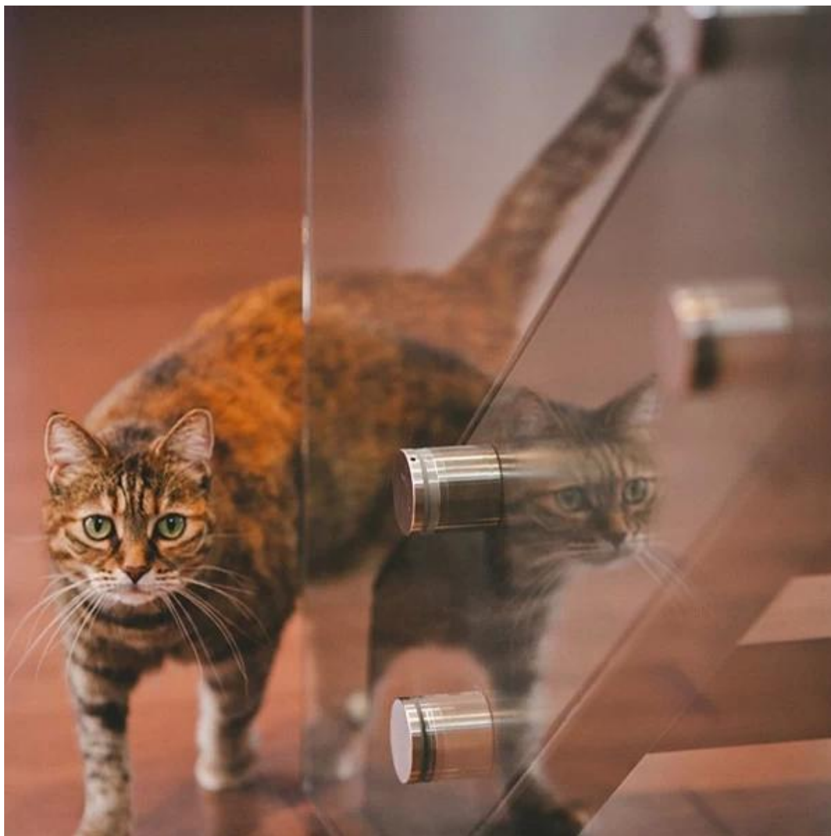
Vidro pin impasse montado na varanda: