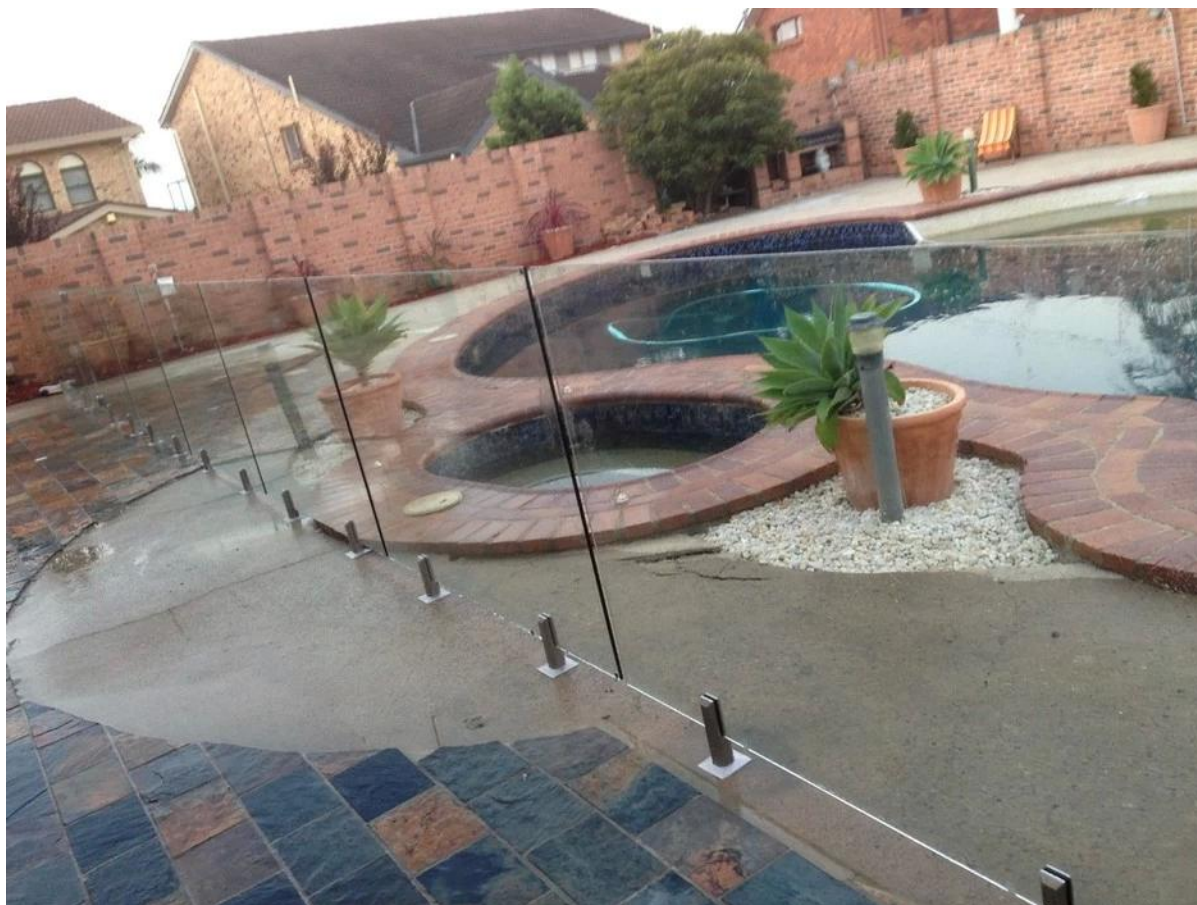
espigão placa de base redonda Modelo No .: RBM-2