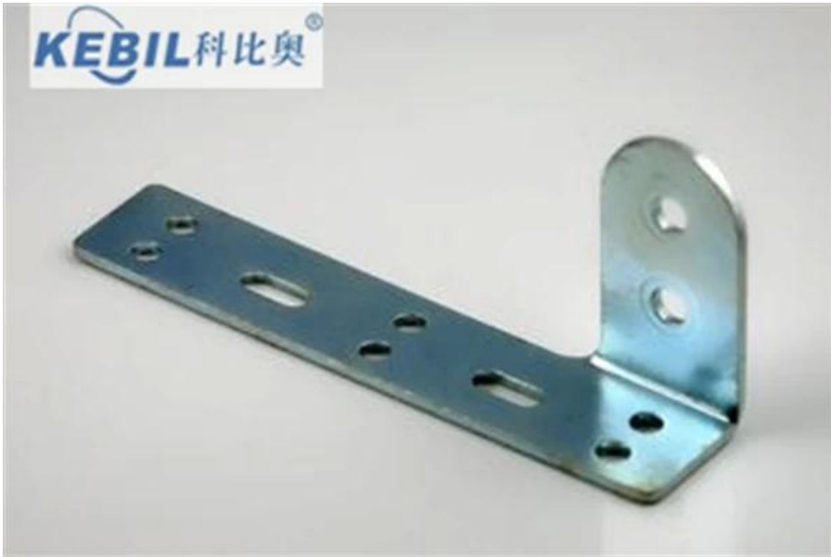
estamparia de metais protótipo