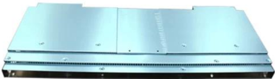
estamparia de metais protótipo