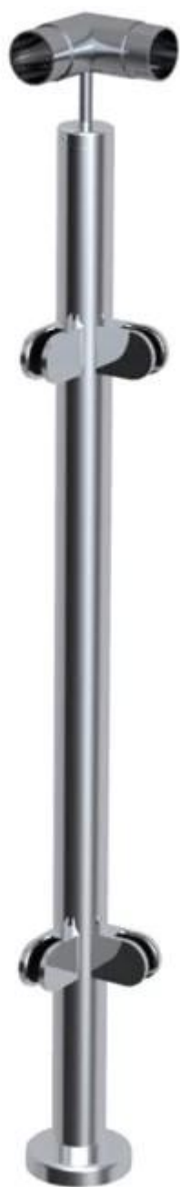
VIDRO GRAMPO MOSTRA