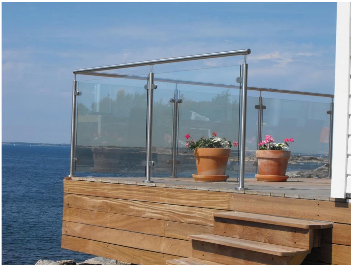
uma forma de pós fim LCH-106