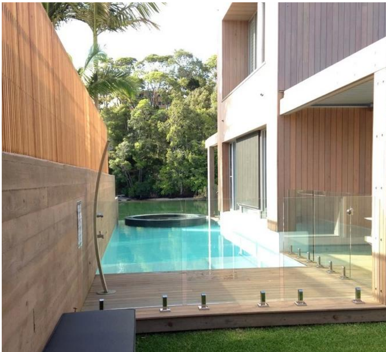
escovado show de SBM-2 do projeto