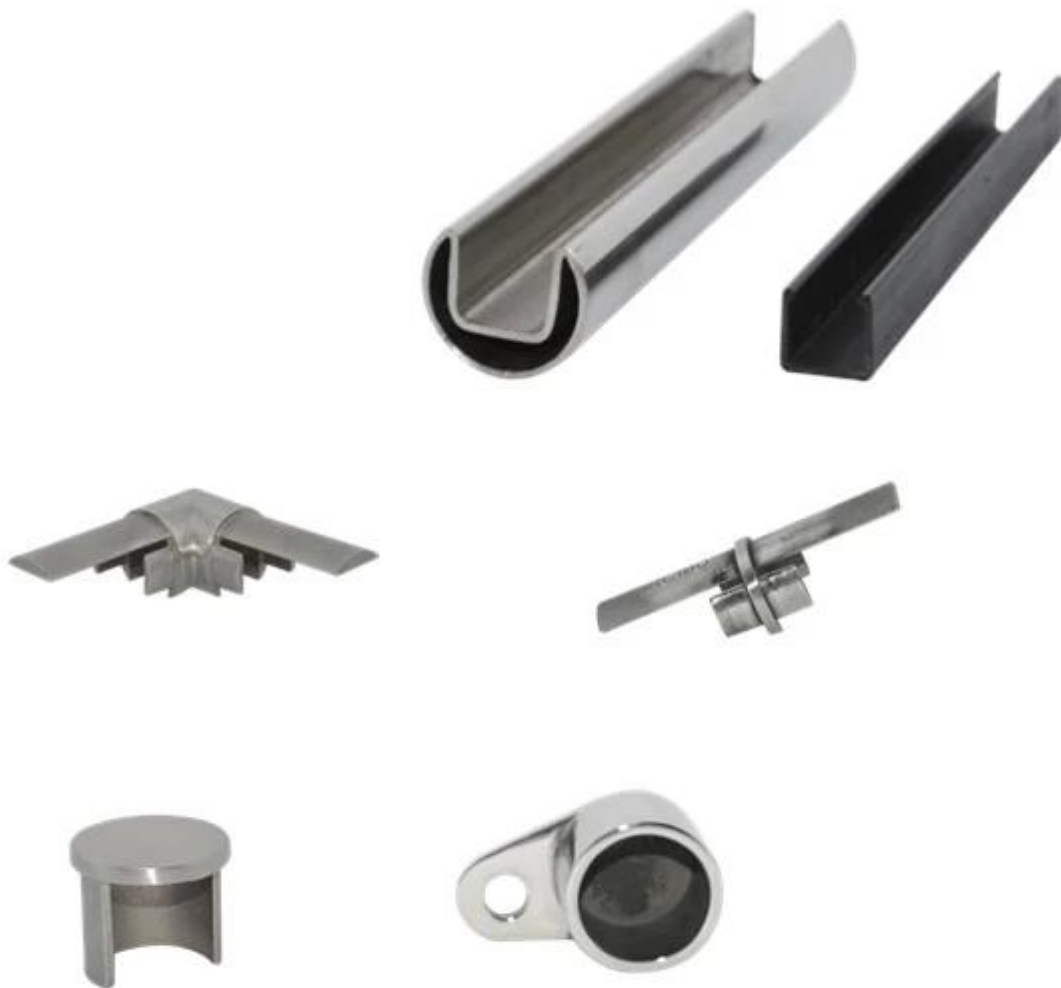
Round slot handrail series