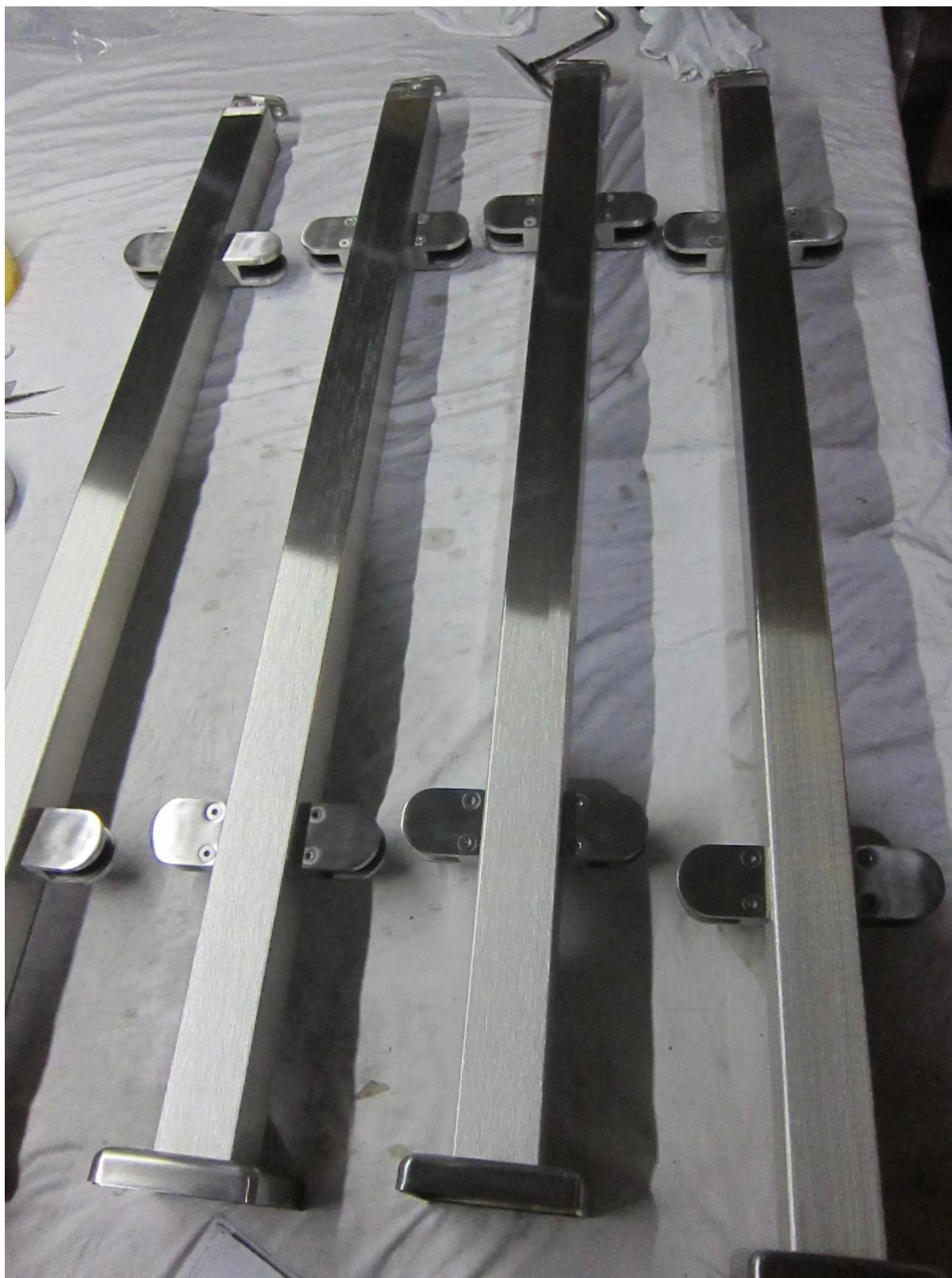
Fotos de instalação das grades de vidro do hotel SOLO SUITE -