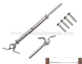
T806- 4mm cable