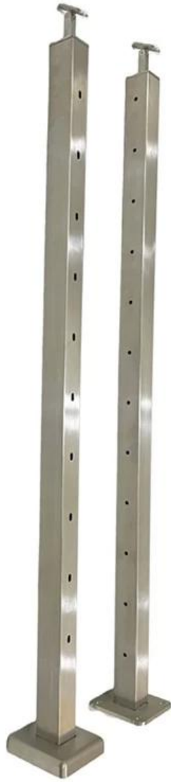
Fotos de produção em massa de cargos de balastrada de aço inoxidável de aço inoxidável para escadas