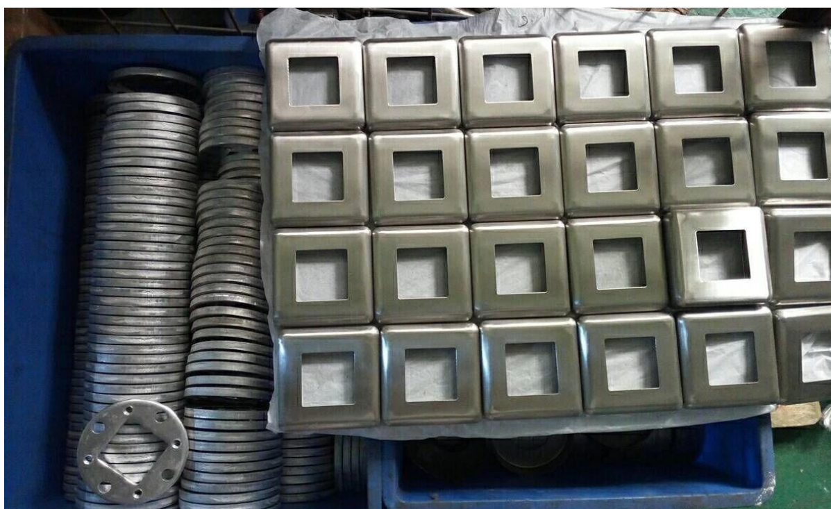
Placa de base para postes (será soldada para postar em nossa fábrica)