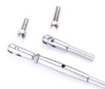
T804- 4mm/5mm/6mm cable