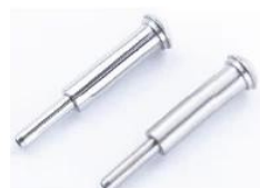
T807- 3mm/4mm cable