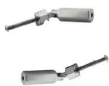
T801- 3mm/4mm cable