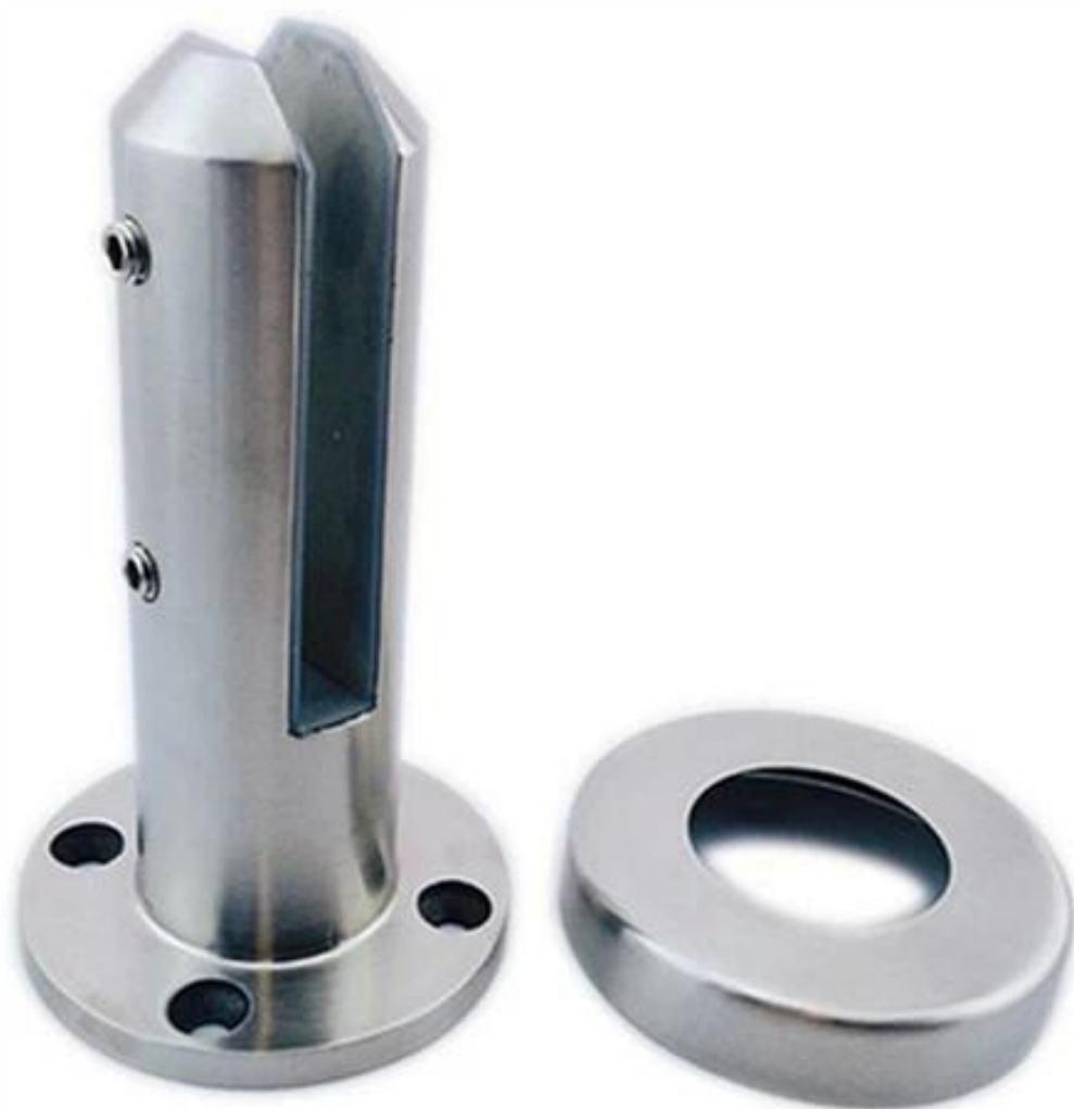
Espigão de broca circular. modelo não.: RCM-2