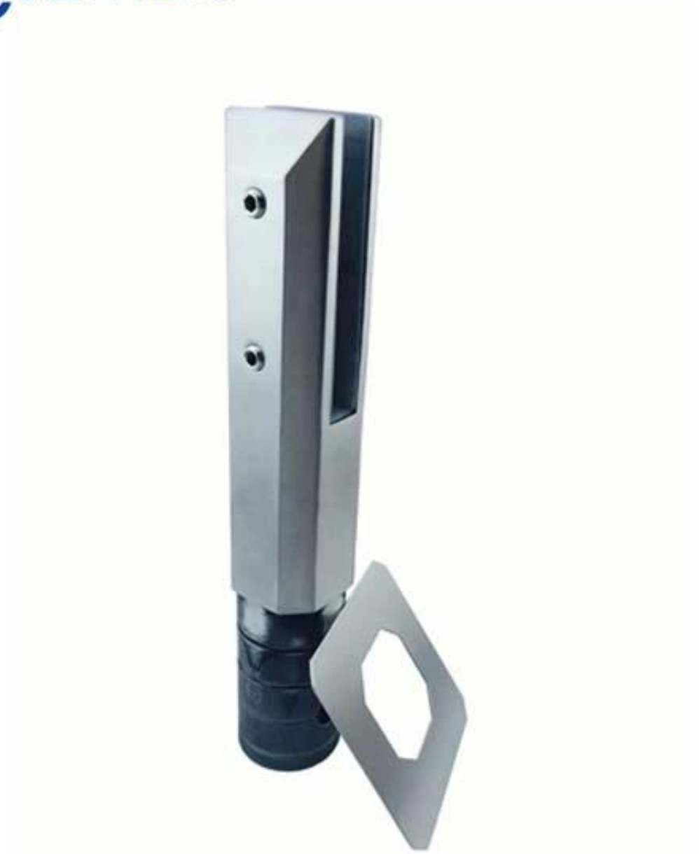
Espigão redondo da placa de base, modelo no .: RBM-2