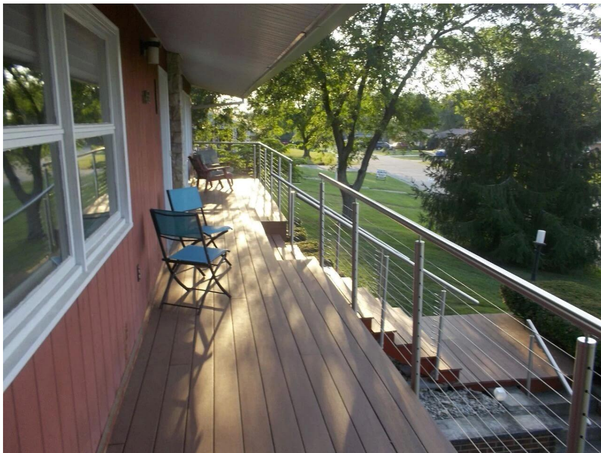
4. Forma quadrada do projeto de aço inoxidável pós cabo trilhos: projeto de cabo trilhos de aço inoxidável para o deck ao ar livre,