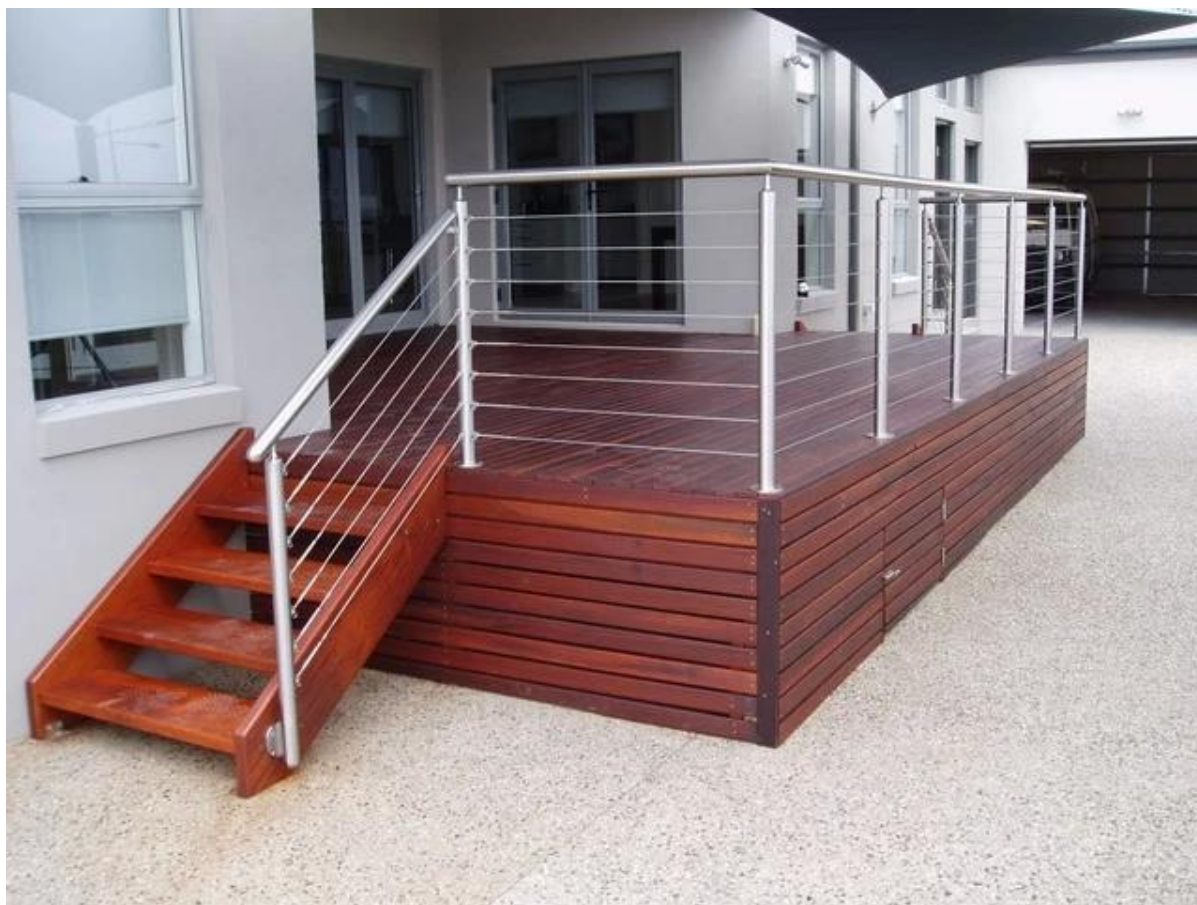
projeto de cabo de aço inoxidável corrimão para escadas interiores