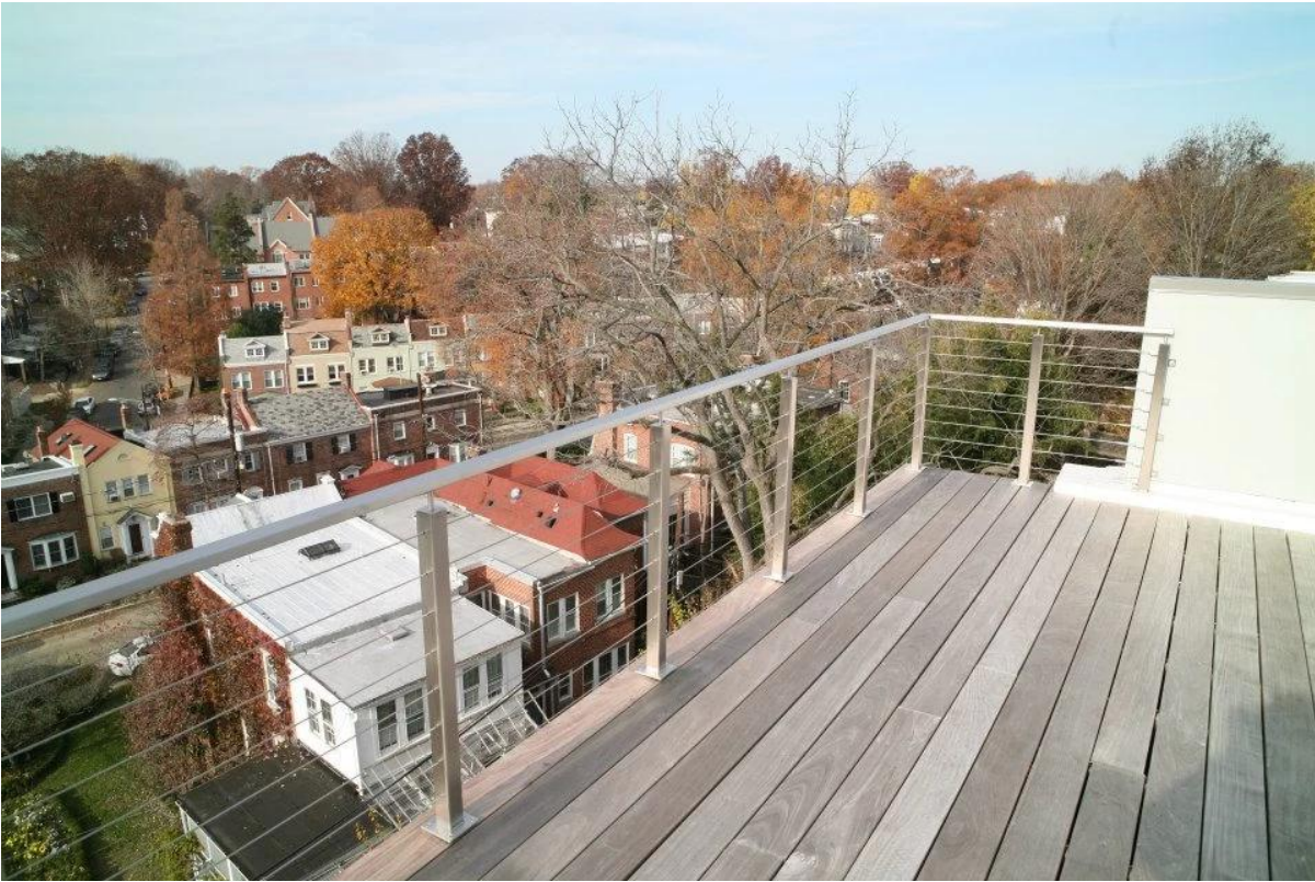
projeto de cabo de aço inoxidável corrimão para escadas interiores