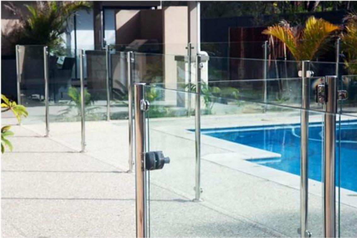
glass handrail system