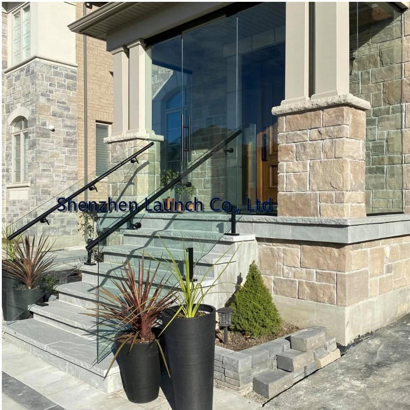
Suporte de corrimão de montagem em parede, P708