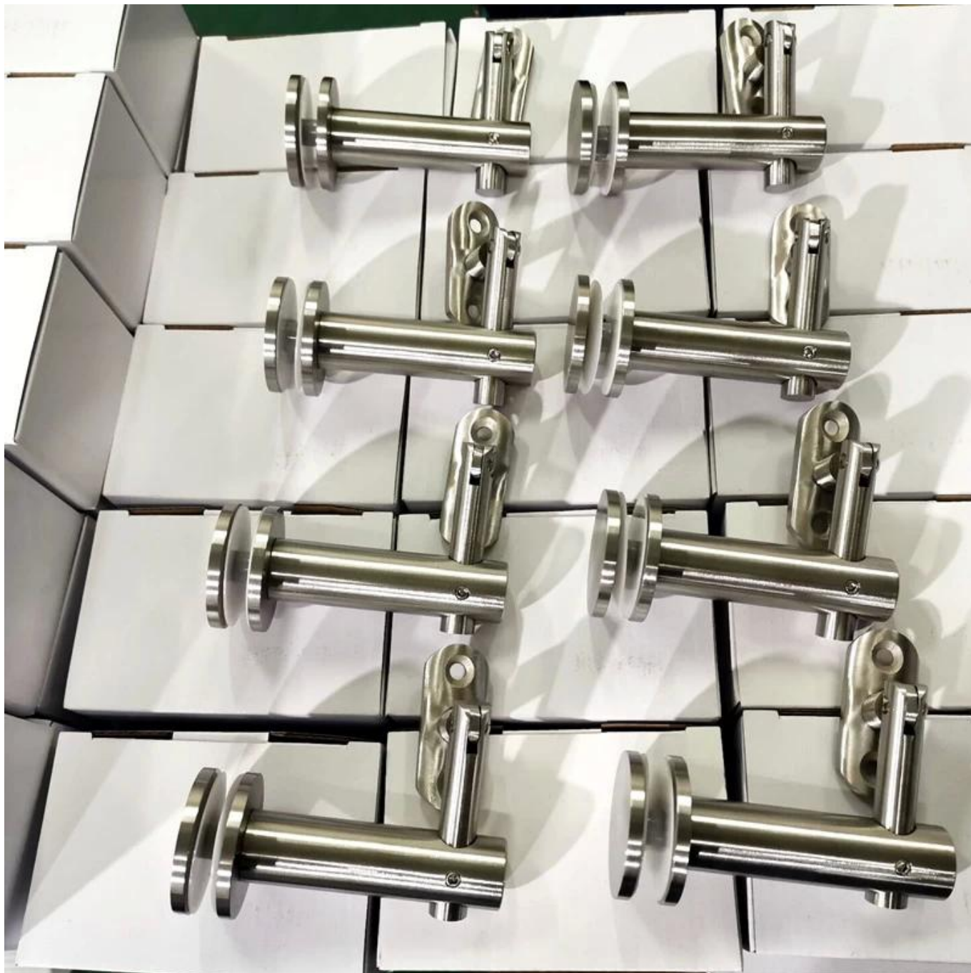
Fotos do projeto de corrimão de vidro -