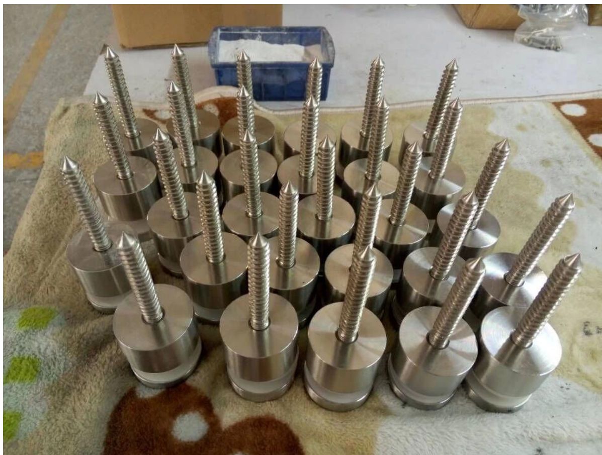
Tipo do parafuso de concreto,