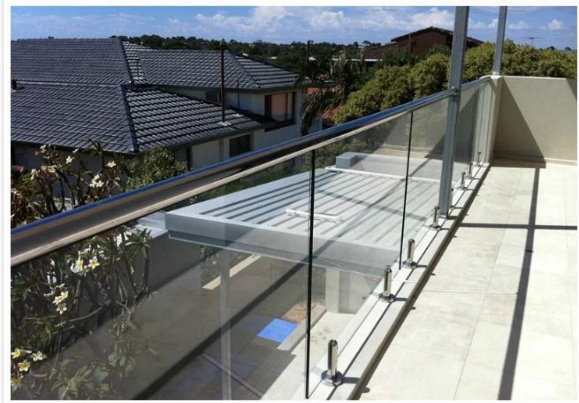
2. aço inoxidável espigão para o projeto piscina: