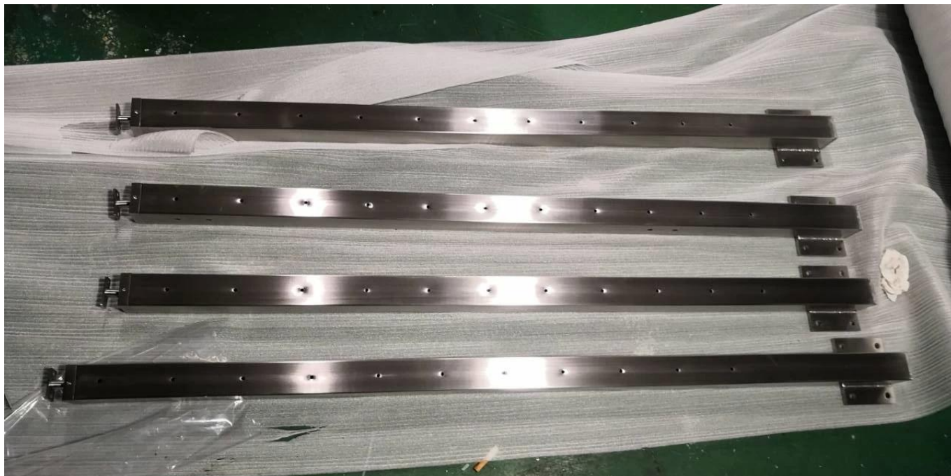
Столбы балюстрады для монтажа на верхней / лицевой стороне для систем перил из нержавеющей стали