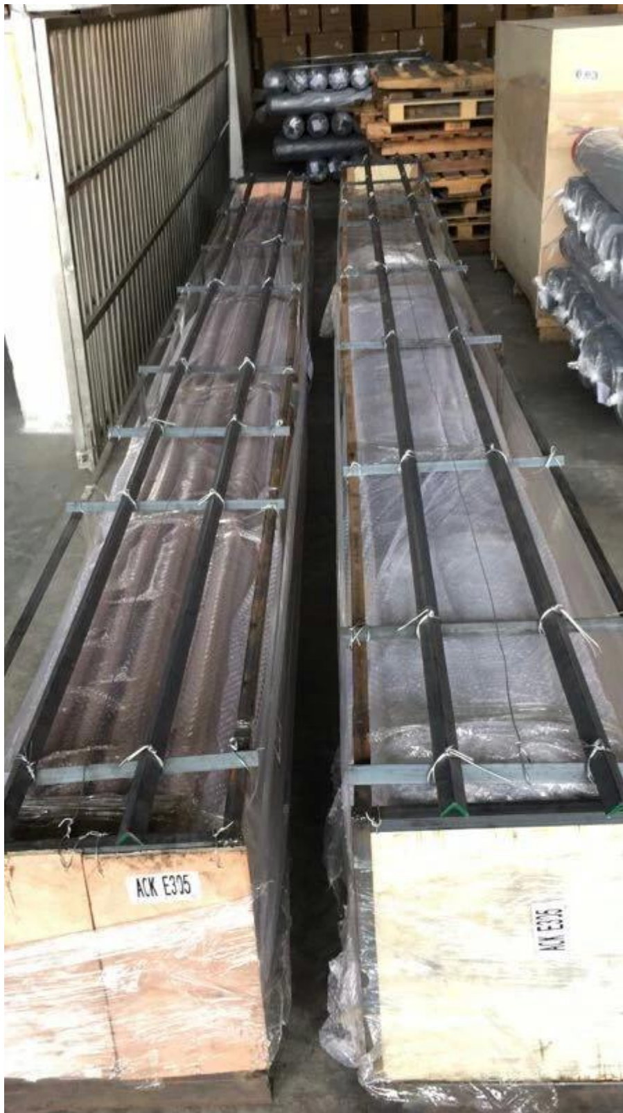
4. Фотографии проекта для Труба и фитинги из нержавеющей стали из нержавеющей стали диаметром 21x25 мм