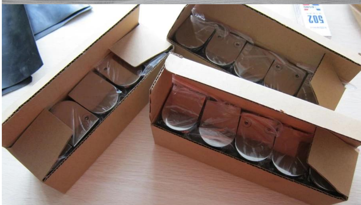
Различные типы стеклянных зажимов с размерами: