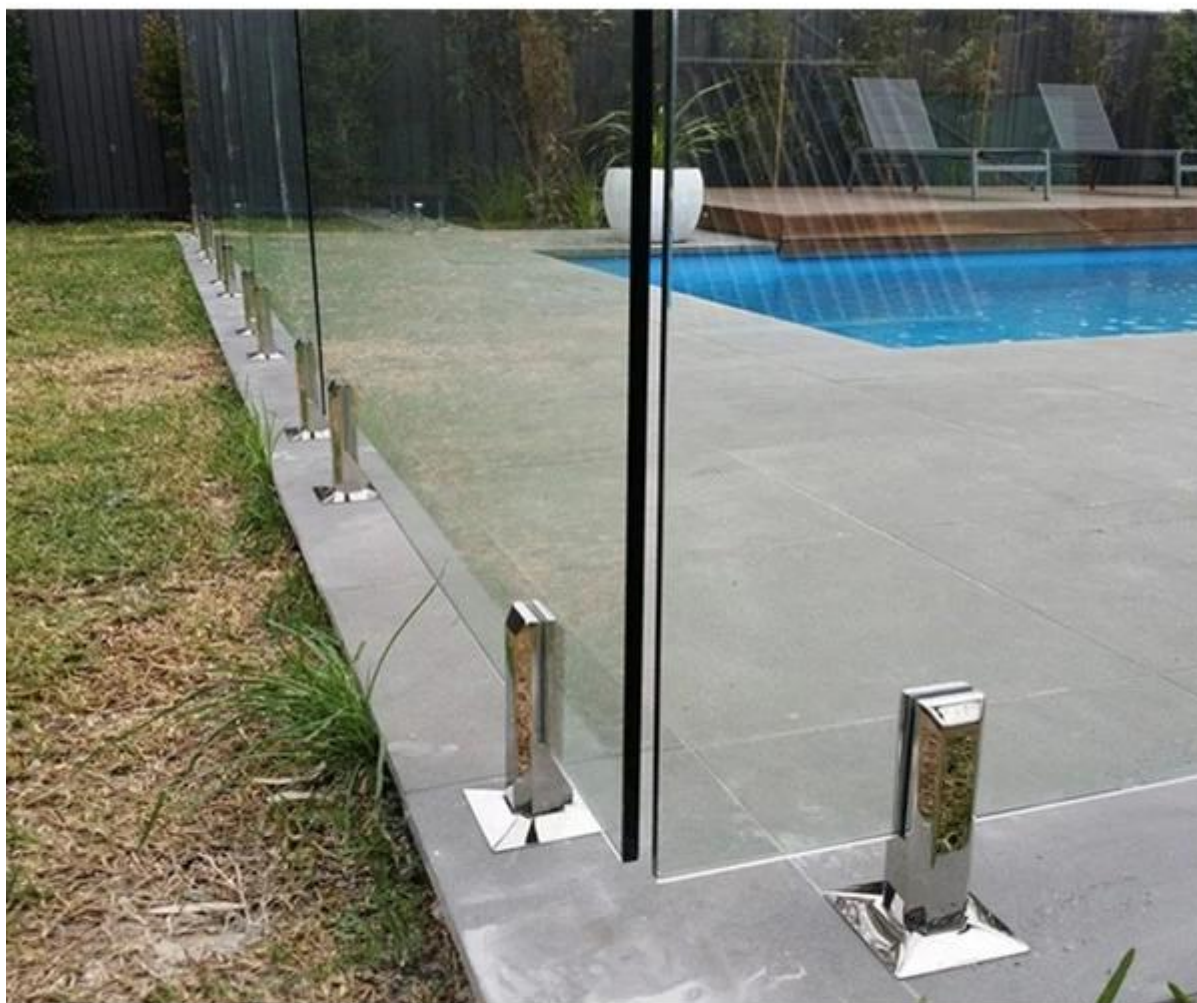
детали упаковки 1 коробка: 12pcs стеклянные Патрубки