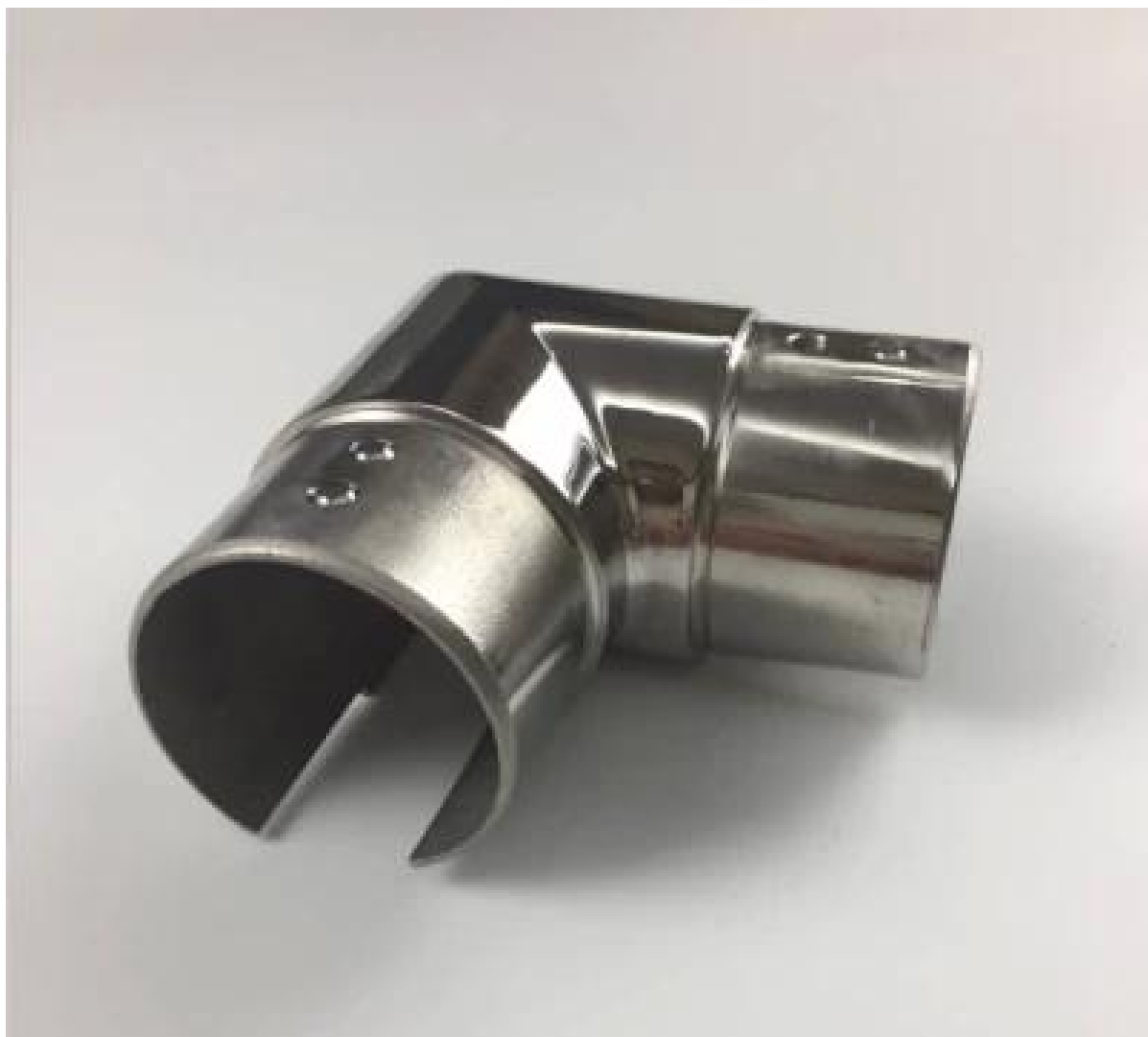
Разъем с прорезями для труб