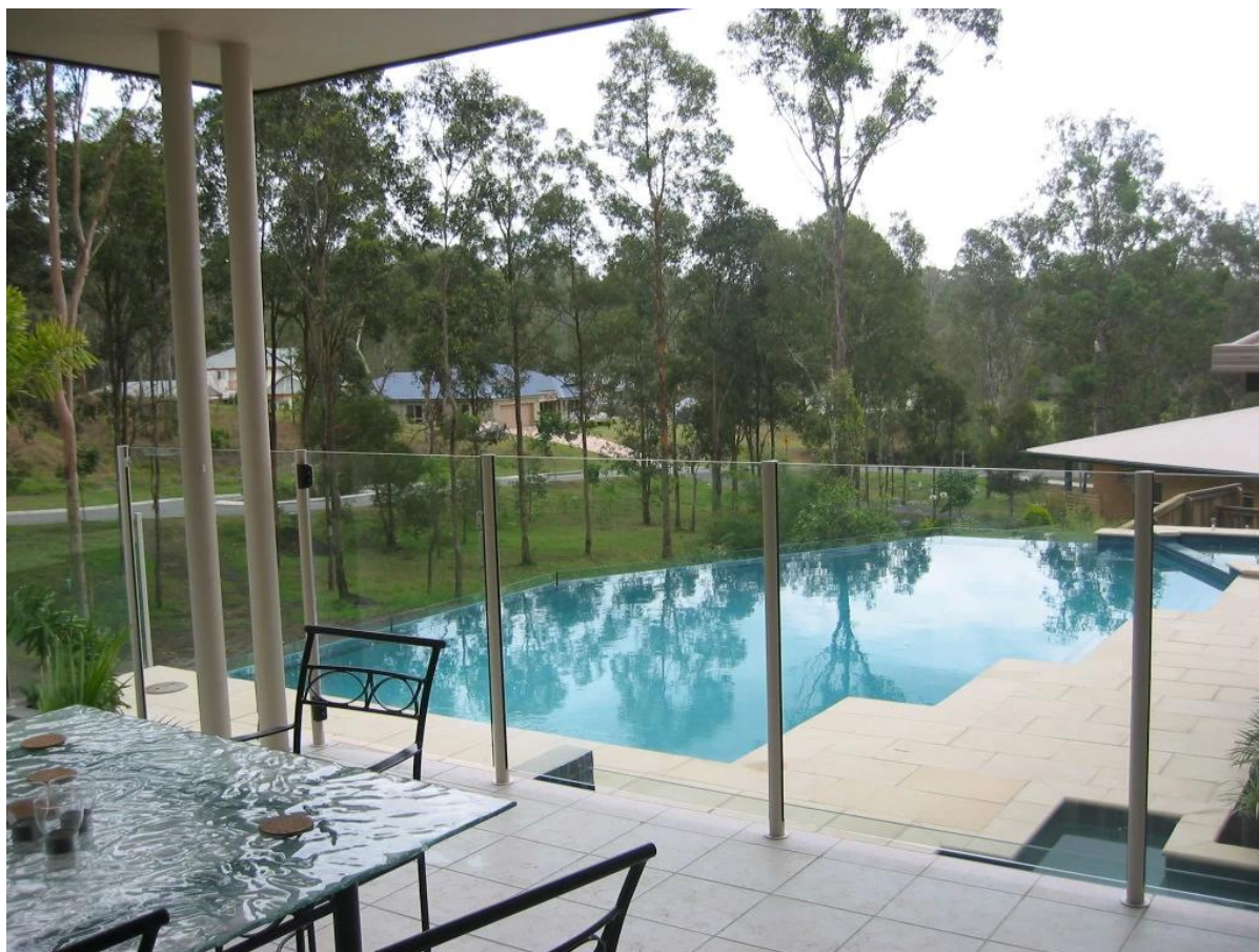
Дизайн алюминиевых перила в Канаде в Канаде