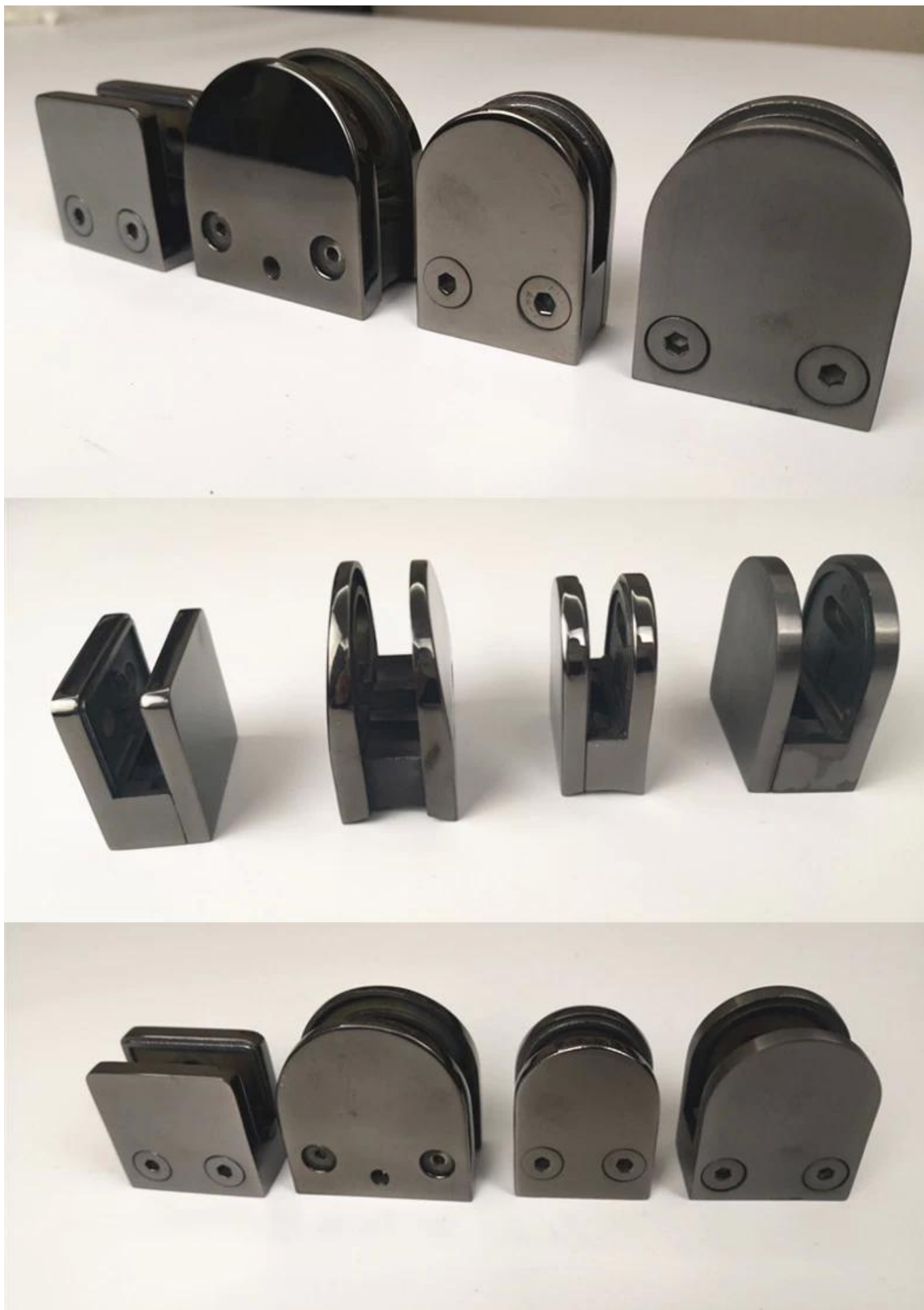
Различные типы стеклянных зажимов с размерами: