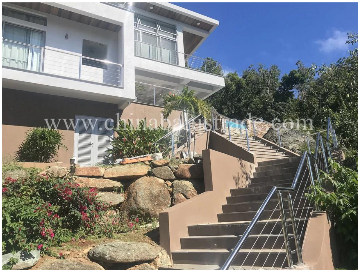
Перила балюстрады из троса в интерьере