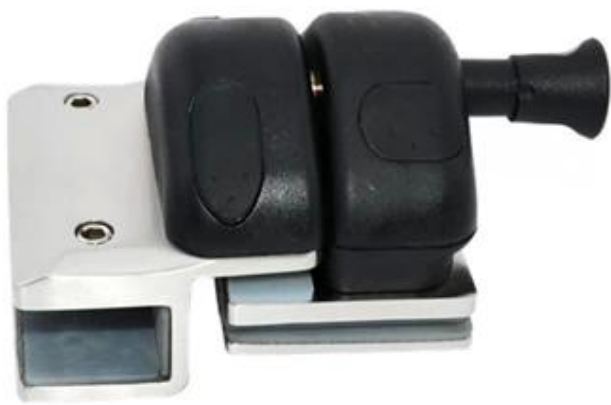
180° glass to glass latch