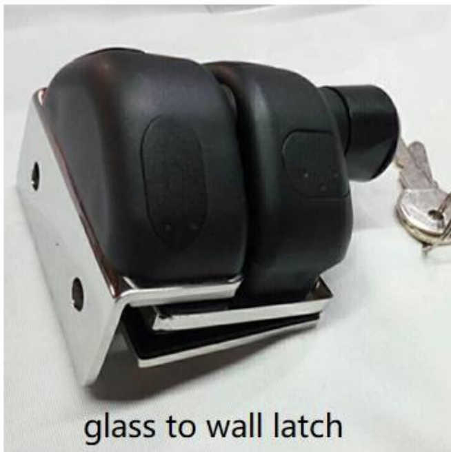
glass to wall latch