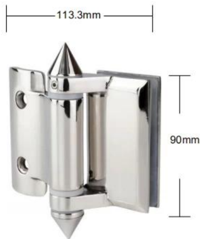
Part # G-R