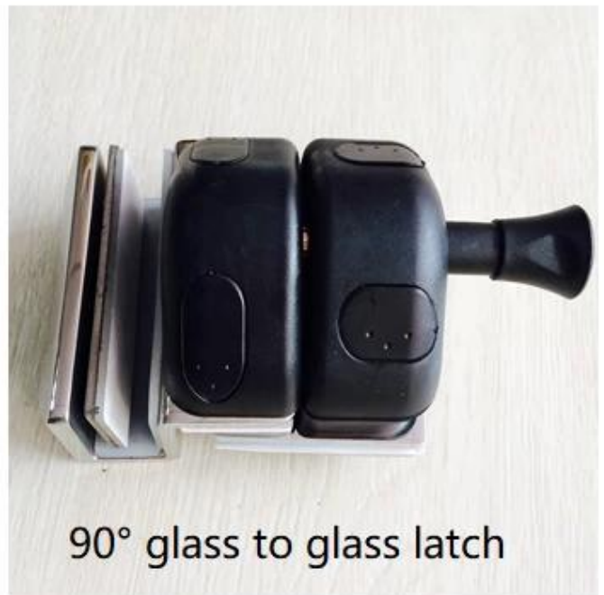
90° glass to glass latch