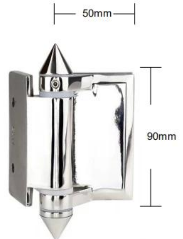
Part # G-W