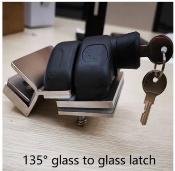
135° glass to glass latch