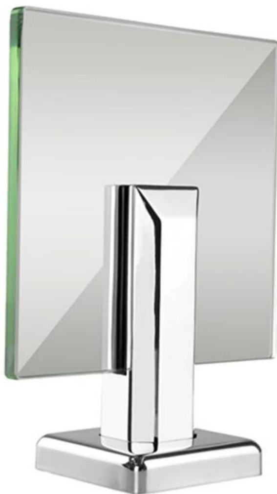
Чертеж для морской втулки из дуплексного стекла 2205 из нержавеющей стали, модель № SBM-