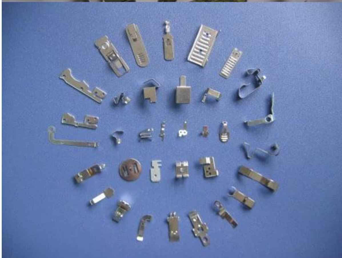
Автозапчасти из листового металла