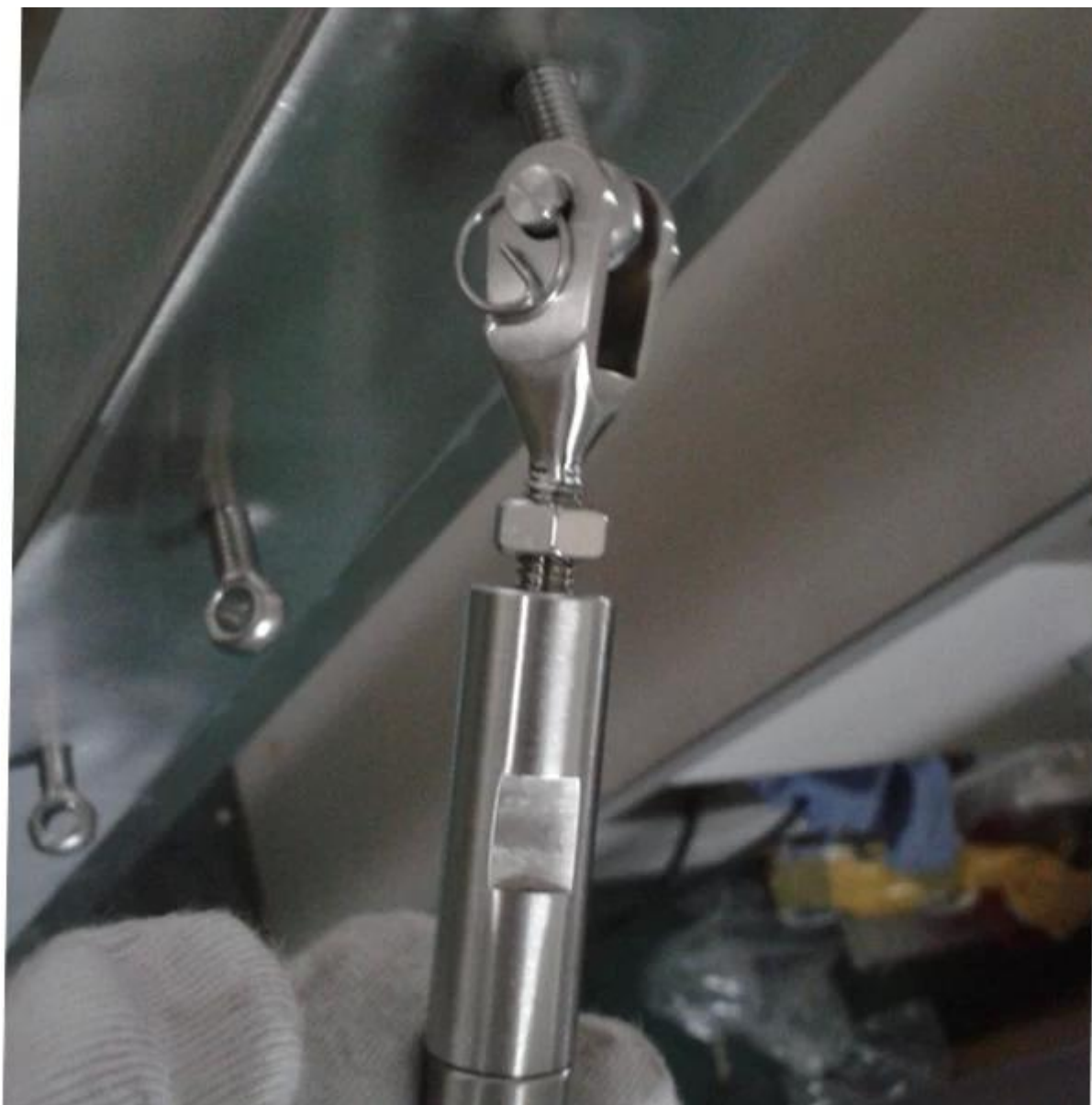
Шоу проекта нержавеющей стальной трос аппаратные средства для лестниц фарфора, фарфора трос балюстрада для балкона