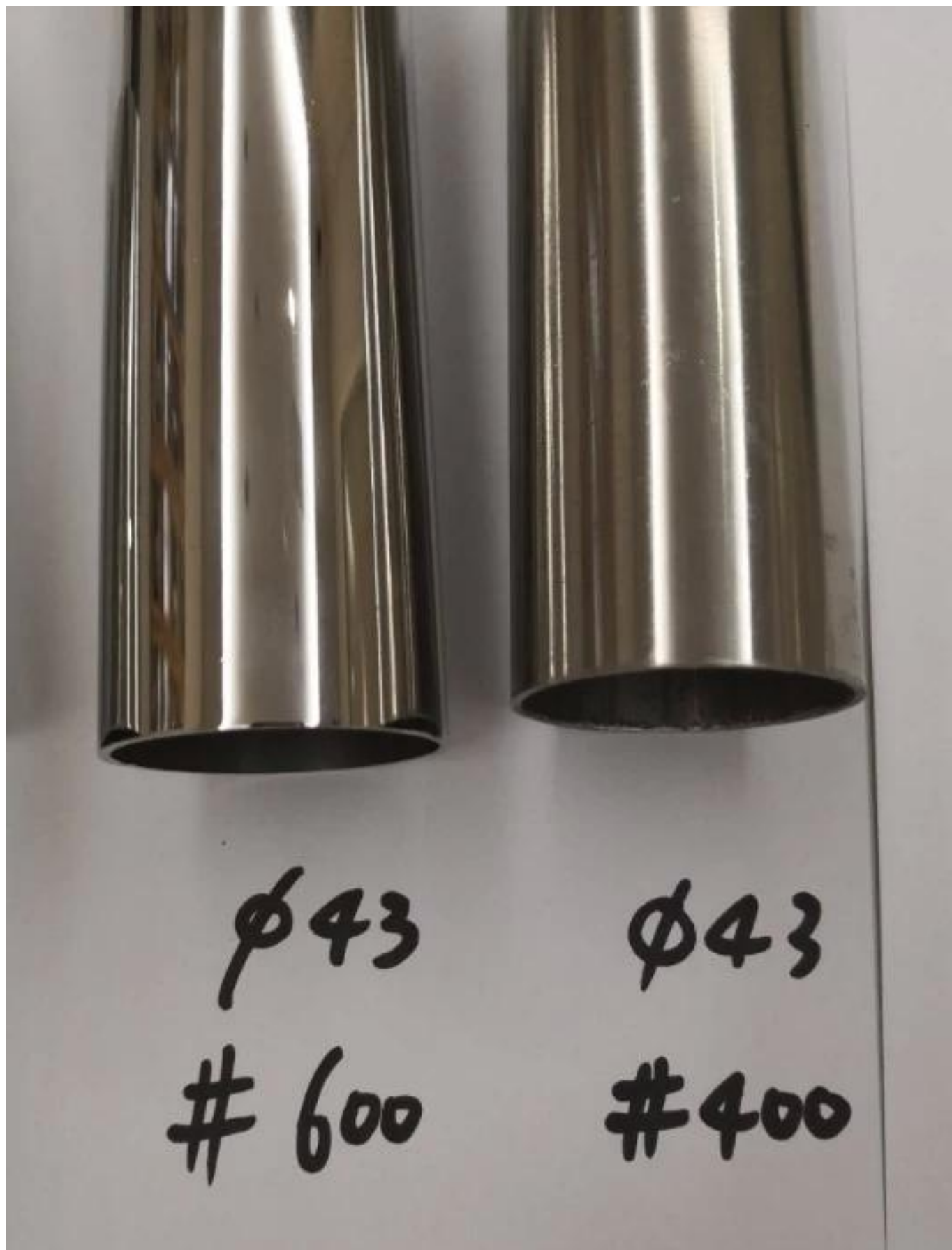
Фотографии производства перил из нержавеющей стали