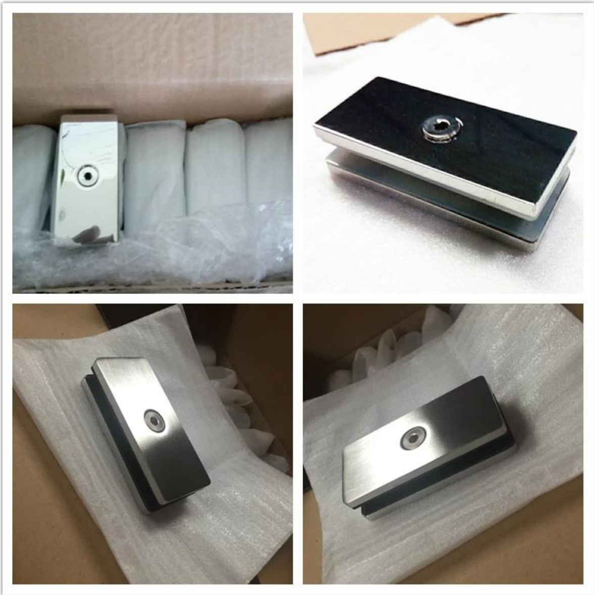
Стекланный зажим Техинальный рисунок