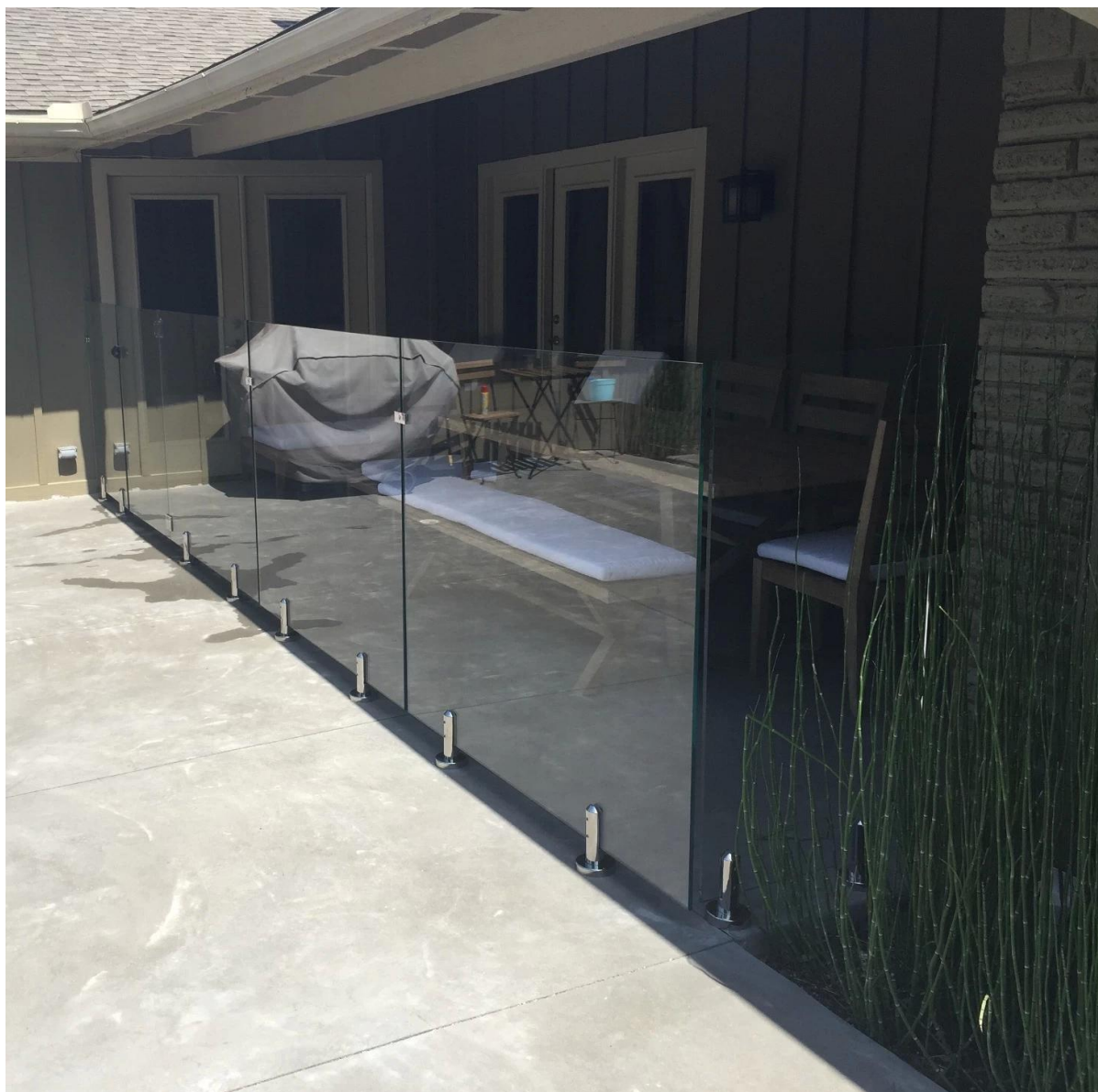
Другие держатели стекла 180 градусов