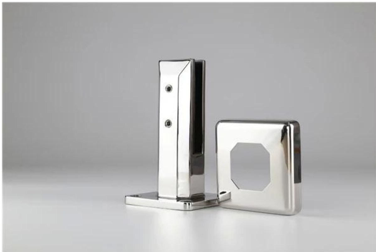
Стеклянная втулка в зеркале полированная: