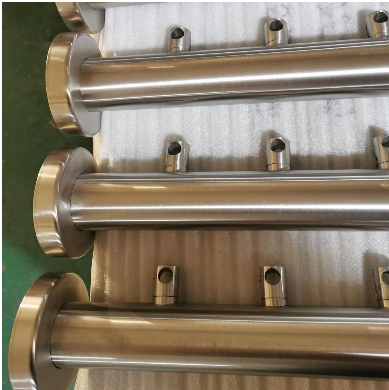
Конецколпачоки суставы дляПересекатьБары: