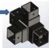
4-way tube connector

For tube dimensions Model 40×40×1.5(mm) S404 50×50×2.0(mm) S504 51×51×3.2(mm) S514 50×50×3.0(mm) S514A