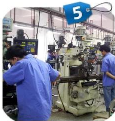
Drilling & Tapping