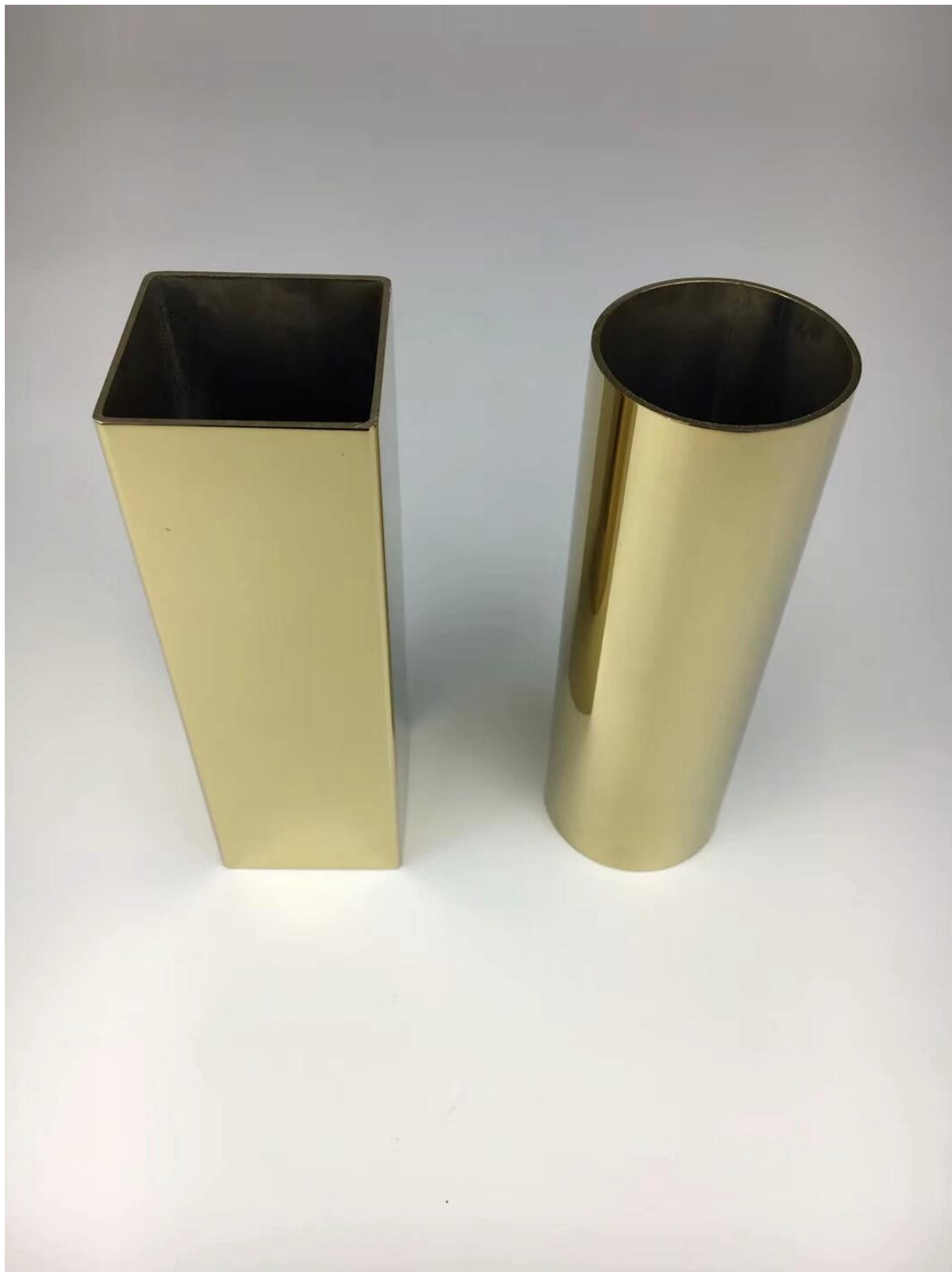
Нормальное зеркало и атласная отделка труб из нержавеющей стали