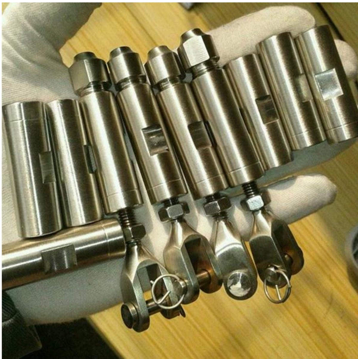
Проект в Калифорнии L.A