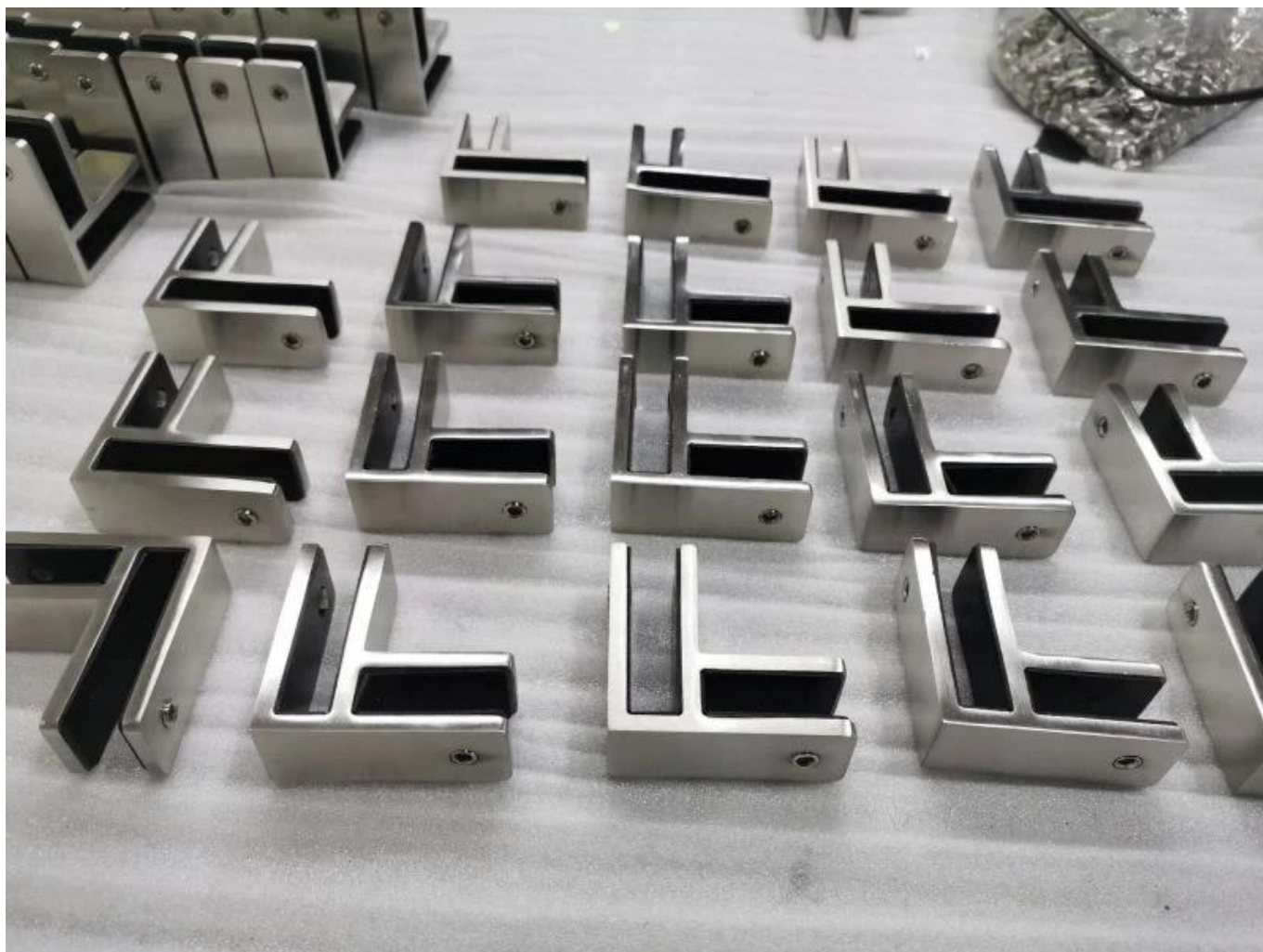
Другие типы зажимов GLAS