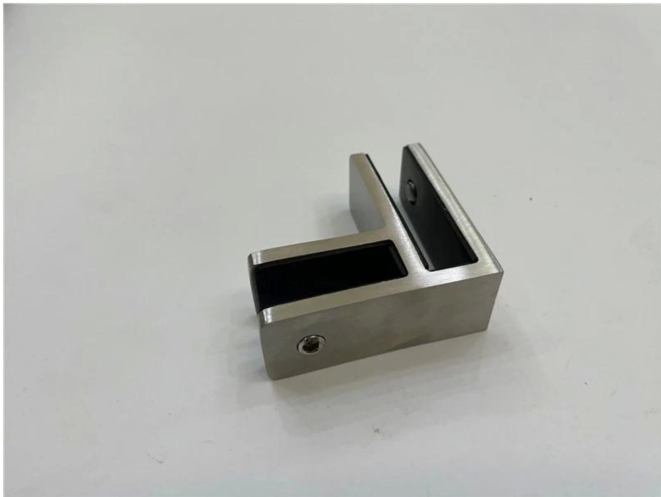
Небольшие винты М8 с пластиковым концом для стеклянного зажима