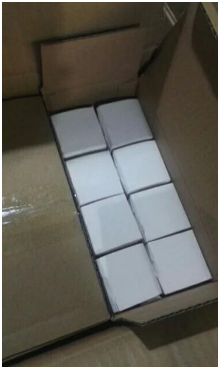
Фотографии проекта с регулируемый круглый стопор из нержавеющей стали для стекла