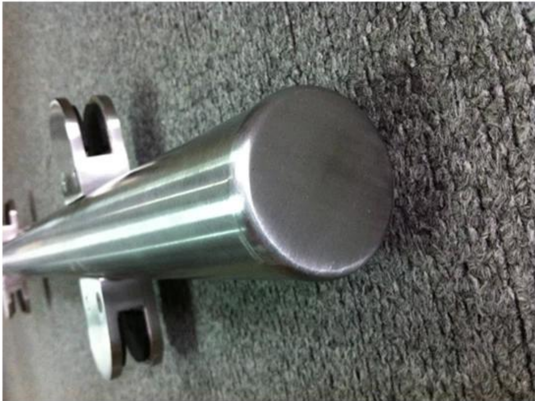
stainless steel end cap