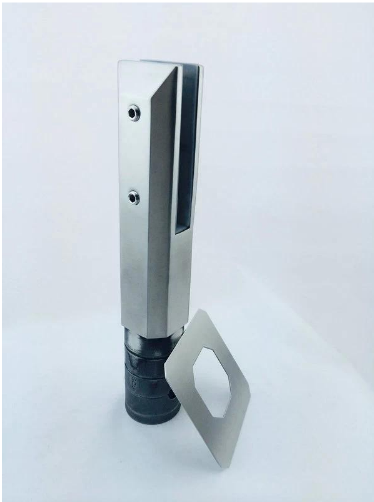
Зеркальная полировка СКМ-2 стекла забор кран; Материал: Морской сорт Дуплекс 2205 или нержавеющей сталь 316