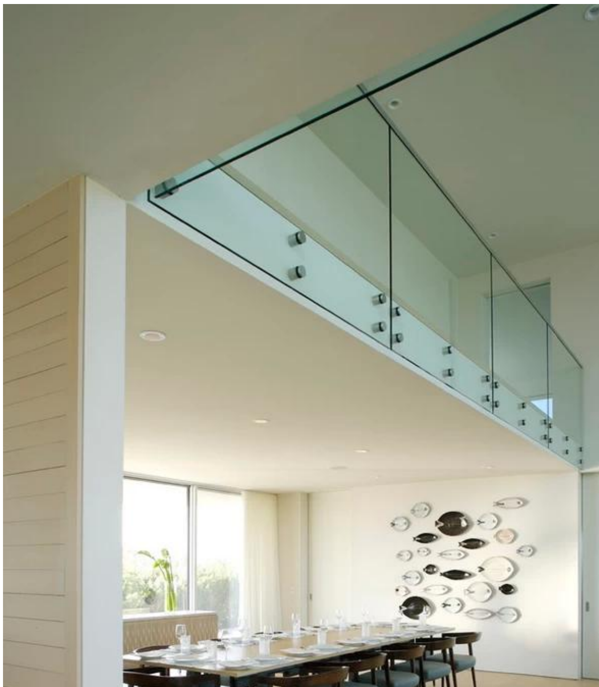
4. стеклянными перилами Модель No.SF-50T стекла Противостояние: JavaScript: недействительным (0); /* 1469851036100 */